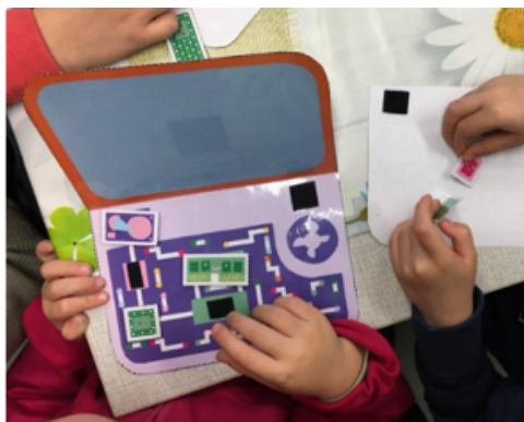
Figure 1 • Construire son propre ordinateur

La première animation consistait à familiariser les enfants avec le matériel informatique et à déshumaniser le robot. Les enfants ont d'abord dessiné leurs représentations d'un robot et d'un ordinateur. Ensuite, ils ont découvert le matériel informatique en construisant leur propre ordinateur, en papier (matériel disponible sur Hello Ruby : http://www.helloruby.com/play/2 ) (Figure 1). Enfin, ils ont manipulé de vrais composants électroniques.