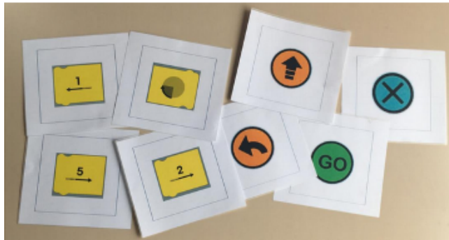
Figure 2 · Un jeu de cartes pour programmer

L'objectif des troisièmes et quatrièmes animations était d'amener les enfants à écrire un programme, à le tester en programmant le robot et à le corriger et/ou l'optimiser (en utilisant les concepts de programmation de variable et de boucle). Cet exercice a été reproduit deux fois (2 x 40 minutes) afin que les enfants puissent manipuler deux robots possédant des langages de programmation différents.