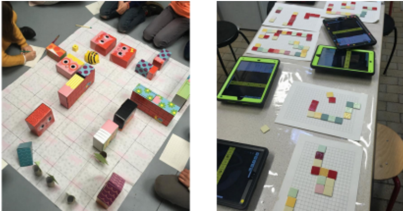
Figure 3 • Programmer les robots