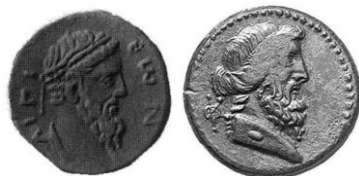
Figure 3. Comparaison des droits d'une monnaie d'Aigion et d'une monnaie au nom de Procléius

La datation avancée par ce dernier reposait en effet sur la ressemblance du droit de ces exemplaires avec ceux des monnaies d'Antonin le Pieux ; pourtant le rapprochement que l'on peut effectuer avec certains droits de l'émission de Procléius à Céphallénie nous paraît tout aussi pertinent 62 , comme l'illustre la figure 3 :