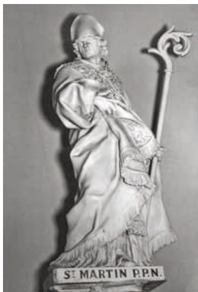
^ Figure 4a. Guillaume Evrard (1709/10-1793), Saint Martin , Dommartin, église Saint-Martin (Saint-Georges-sur-Meuse). Tilleul polychromé, h. 128 cm.