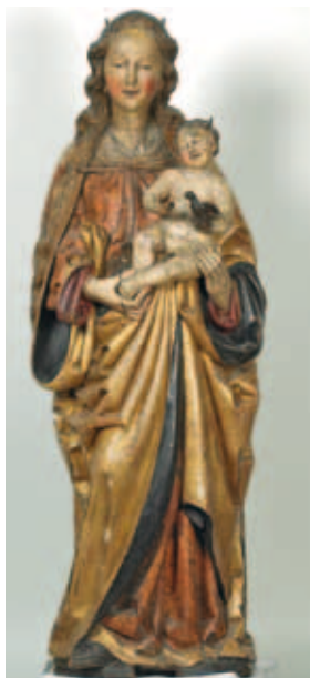
^ Figure 10. Maître du Calvaire de Fize-le Marsal, Vierge à l'Enfant , Liège, basilique Saint-Martin, ca 1490. Chêne polychromé.