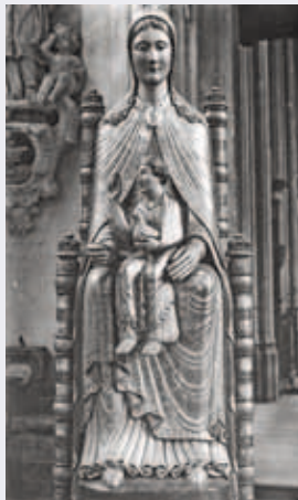
^ Figure 2. Nicolas De Bruyne et Jos Van Uytvanck, Sedes Sapientiae (avant et après bombardement, après restauration), Louvain, église Saint-Pierre, 1442. Tilleul polychromé.