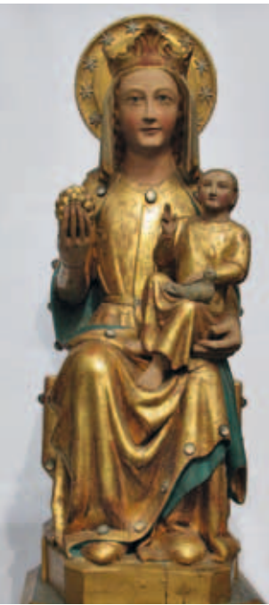
^ Figure 5. Notre-Dame d'Ittre , église Saint-Remi, anciens Pays-Bas méridionaux, 3 e quart du XIII e s. Chêne, fortement restaurée, polychromie XIX e s., h. 75 cm.