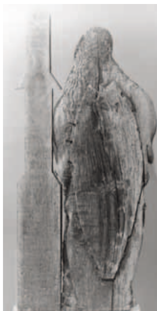
< Figure 6b. Dendrochronologie : estimation de la réalisation après 1490, tour du XIX e siècle.