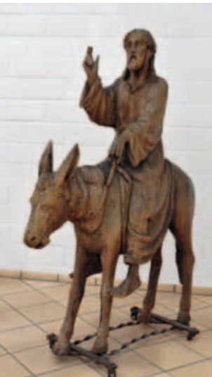
^ Figure 3. Christ des Rameaux, France, Picardie (?), musée de Louvain-la-Neuve, ca 1530-1550. Chêne, h. 179 cm.

Les proportions de cette splendide représentation du Christ entrant à Jérusalem sur une ânesse, mais surtout la polychromie, très probablement réalisée au naturel , témoignent d'un type d'images qui visait à l'illusionnisme total. Malgré la forte usure et les diverses réfections importantes, le raffinement extrême de la plastique, encore largement perceptible à maints endroits, autorise à situer l'œuvre dans le courant stylistique du maniérisme, c'est-à-dire dans la phase tardive de la Renaissance. Les quelques dizaines de Christ des Rameaux qui sont parvenus jusqu'à nous proviennent presque tous des territoires de l'Empire germanique et, par leur style, ils s'inscrivent pleinement dans le style gothique. Celui de Louvain-la-Neuve est donc exceptionnel, à la fois par ses qualités plastiques et stylistiques, mais aussi par ses origines, qu'il faut probablement situer en Picardie.