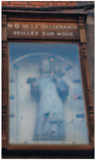
^ Figure 12. Atelier mosan ?, Vierge à l'Enfant , Namur, rue de l'Ange, xiv e siècle (en haut, vue en situation). Bois polychromé.