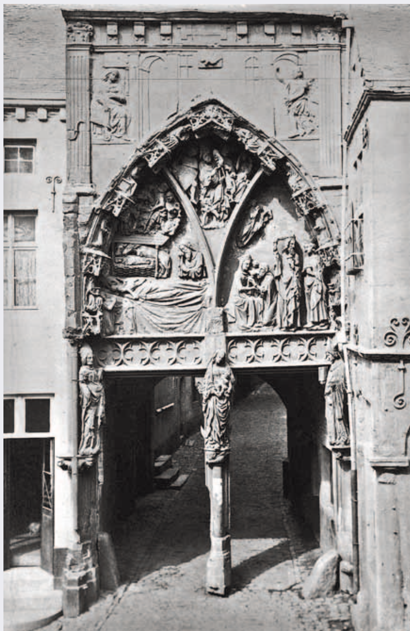
^ Figure 7a. Portail de la collégiale de Huy, dit du « Bethléem ». Cliché antérieur à 1880.