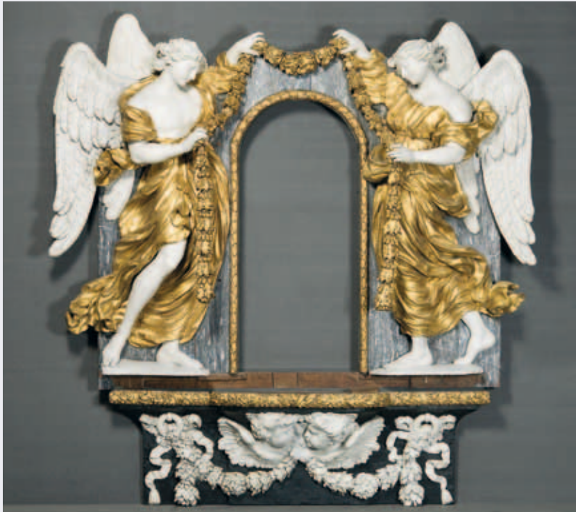
◀ Figure 1. Jean Del Cour (1631-1707), fragments de retable, Huy, église Notre-Dame de la Sarthe, ca 1669. Tilleul polychromé.