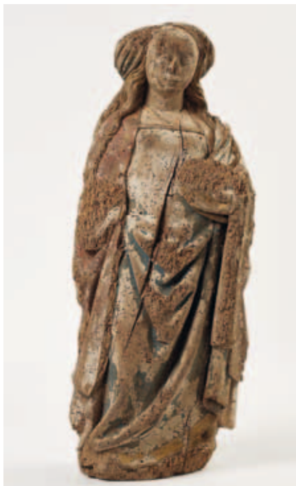
^ Figure 11. Atelier brabançon, Sainte Marie-Madeleine (?) , Langdorp, église Saint-Pierre, xvi e siècle. Chêne polychromé.

retrouvé une tête de sainte ou d'ange et une statuette de sainte (Marie-Madeleine ?) 18 , toutes deux en bois polychromé et réalisées par un atelier brabançon au début du xvi e siècle (figure 11). Enfin, de nombreux témoignages du xix e siècle font état de monuments funéraires murés dans leur enfeu qui ont été retrouvés lors de travaux de restauration.