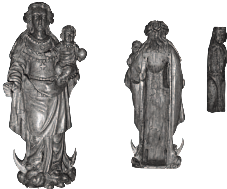
> Figure 9. Vierge à l'Enfant (xviii e s.) de face et de dos ; au revers, emplacement d'une Sedes (ca 1180-1230) visible à l'extrême droite, Sainte-Marie-sur-Semois, église paroissiale. Chêne.

dans la nouvelle image, ses vertus apotropaïques étaient également transférées. Voilà un phénomène particulièrement passionnant, encore peu étudié.