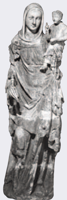
^ Figure 7b. Vierge à l'Enfant , Huy, trésor de la collégiale, dernier tiers du XIV e s. Tuffeau et plâtre, h. 165 cm.