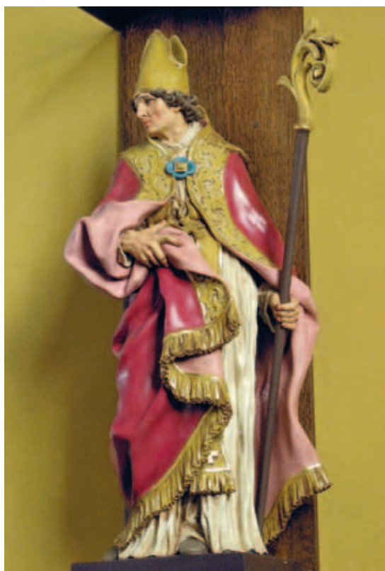
^ Figure 4b. Même statue repeinte « au naturel ». Cliché de l'auteur.