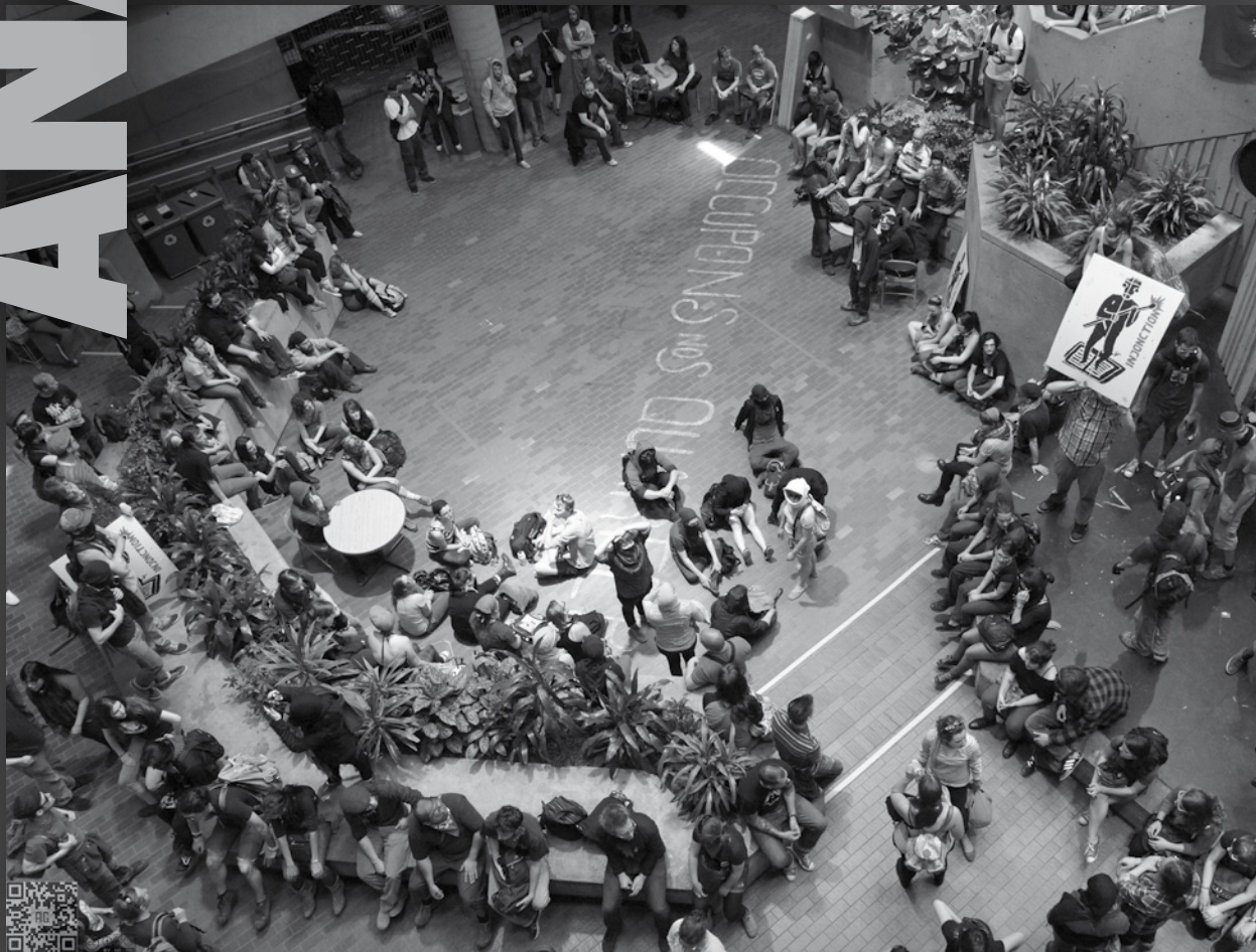
Comme un air de mai 68 québécois