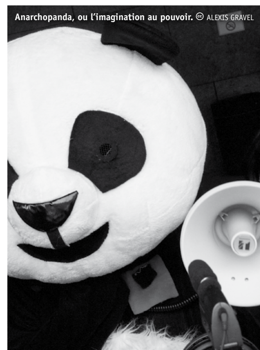
Anarchopanda, ou l'imagination au pouvoir.

Les citoyens ont le sentiment que les sociétés occidentales se sont imposé ces contraintes à elles-mêmes et ils veulent retrouver une capacité de choix.