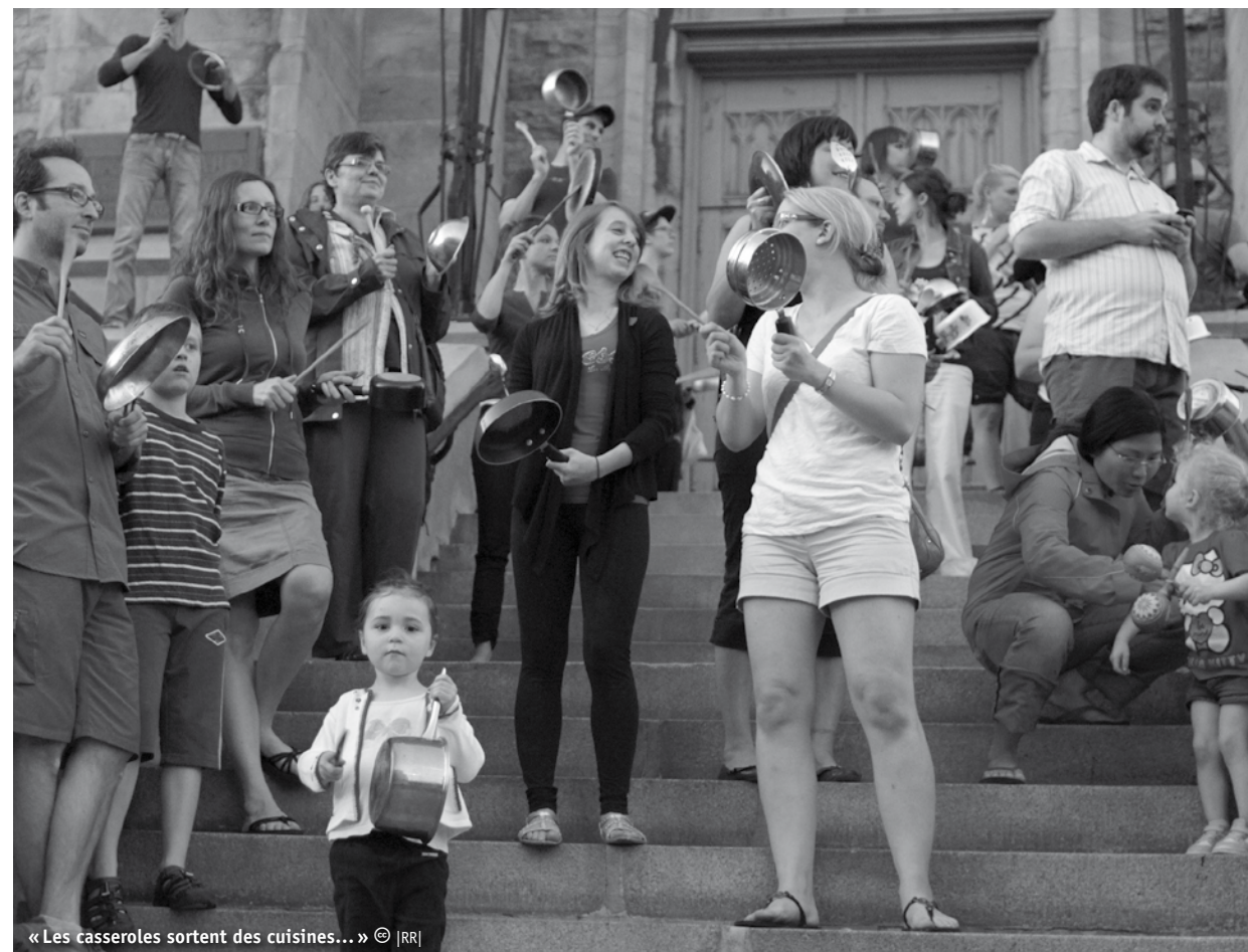
« Les casseroles sortent des cuisines... »

mobilisation, Anarchopanda est un manifestant portant un costume de panda – alors que le port du masque a été déclaré illégal – qui participe aux manifestations, au cours desquelles il passe son temps à câliner les personnes qu’il rencontre et qui n’hésite pas à s’interposer entre les étudiants et les forces de l’ordre.