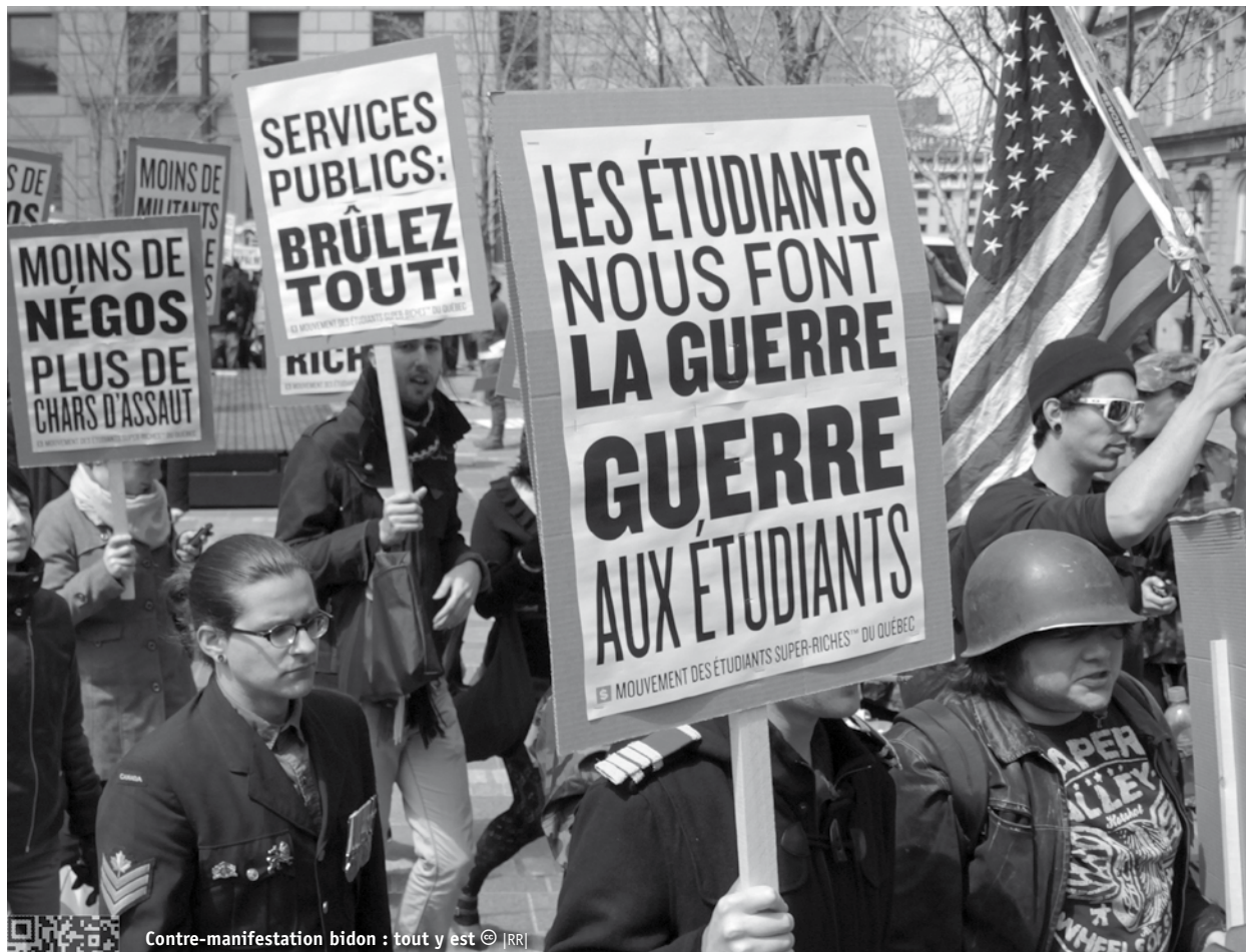
Contre-manifestation bidon : tout y est