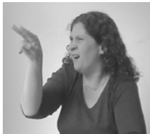
[5] REGARDER (transfert)