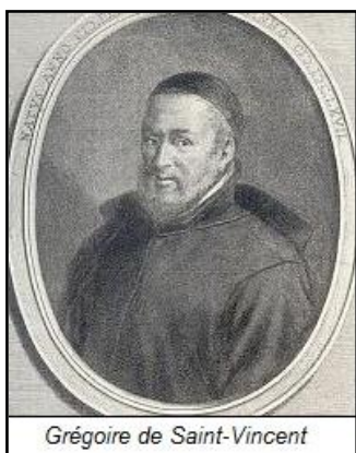
Grégoire de Saint-Vincent

Au début du 17 e siècle, le mathématicien écossais John Napier (1550 – 1617) introduisit la notion de logarithme dans le but de simplifier les calculs de produits et de quotients. En gros, il s'agit de transposer ces opérations arithmétiques au moyen d'une représentation exponentielle de tout réel