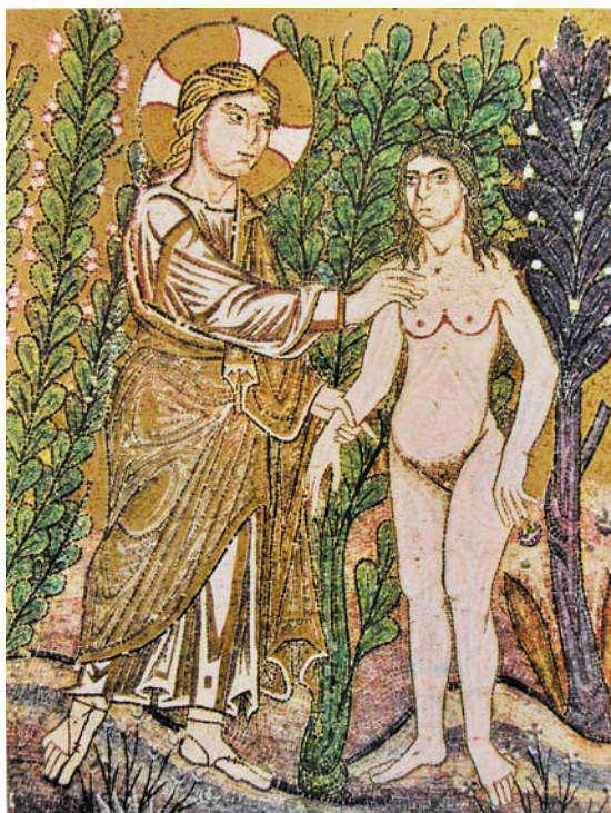
La création d'Eve mosaïque, Cathédrale de San Marco à Venise.

et la maternité l'accomplissement de la vocation féminine. Une telle affirmation n'est-elle pas paradoxale dans la bouche d'une féministe ? Au contraire : un féminisme radical, dont le but est le plein épanouissement de la femme, ne saurait se cantonner au problème de la parité sans verser dans un « machisme inversé » où n'est désirable que ce qui nous a été désigné comme tel par l'homme. Certes, Edith Stein rappelle que la femme est bien un être autonome, qui existe pour lui-même au regard de Dieu.