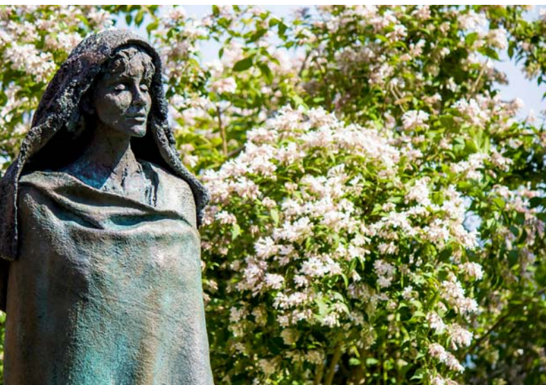
Hildegarde von Bingen, Abbaye Ste-Hildegarde à Rudesheim