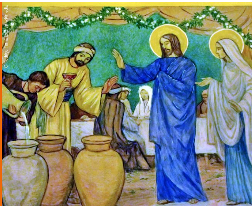
Les noces de Cana, église Nuestra Señora, Los Angeles

Marie « coopéra, d'une manière toute spéciale, à l'œuvre du Sauveur par l'obéissance, la foi, l'espérance et l'ardente charité pour instaurer la vie surnaturelle des âmes. Et, pour ce motif, elle fut pour nous notre mère dans l'ordre de la grâce. » ( Lumen Gentium , 61) « Cette maternité de Marie dans l'économie de la grâce perdure sans arrêt, depuis le moment qu'elle donna fidèlement son assentiment dans l'Annonciation et qu'elle maintint sans hésitation sous la croix, jusqu'à ce que tous les élus soient couronnés pour toujours. En effet, élevée au ciel, elle n'a pas déposé cette fonction salutaire, mais par ses multiples intercessions, elle continue à nous faire obtenir les grâces du salut éternel. (...) Pour ce motif, la Bienheureuse Vierge est invoquée dans l'Église avec les titres d'Avocate, d'Auxiliaire, de Secourable et de Médiatrice. Cela doit être entendu de manière à ne rien enlever, à ne rien ajouter à la dignité et à l'efficacité du Christ, seul médiateur. » ( Lumen Gentium 62)