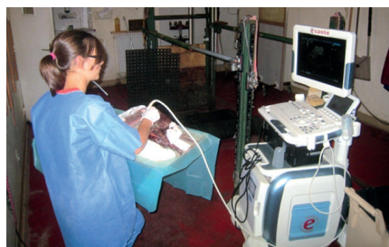
Photo 1 : Travail de recherche réalisé ex vivo en collaboration avec une clinique privée

être gérés dans un délai court et permettent d'utiliser les techniques à disposition. La collaboration avec des vétérinaires privés (cf. photo 1) est particulièrement riche car elle permet de contextualiser le projet et d'associer la démarche à la réalité de la pratique (Vandeweerd et al. , 2014b). À l'inverse, les études cliniques (sur animaux vivants) ne conviennent pas car elles sont longues et ont des implications éthiques importantes.