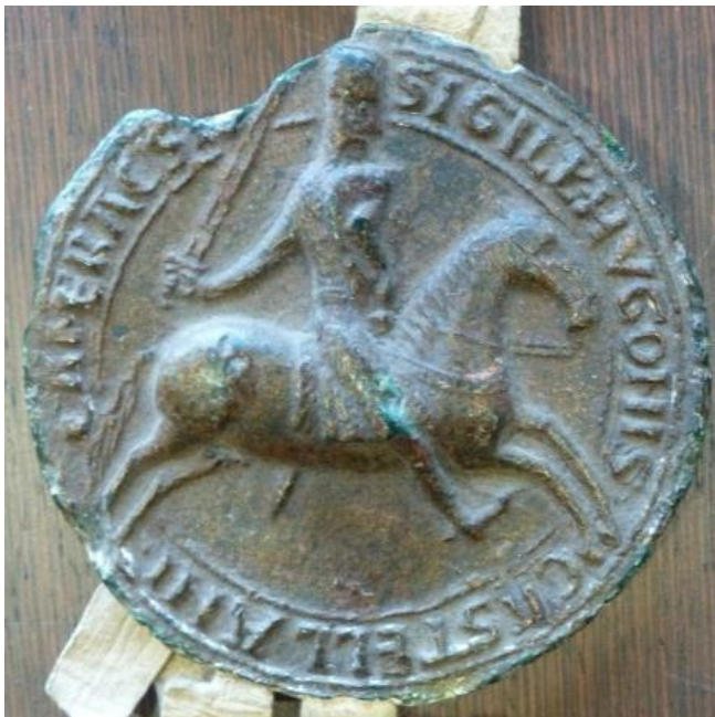
Ill. 4. – Troisième sceau d'Hugues III d'Oisy, châtelain de Cambrai et vicomte de Meaux, 1185 (Lille, AD Nord, 28 H 38/1060).