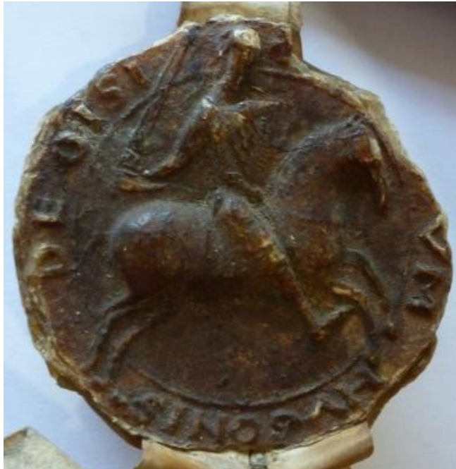
Ill. 3. – Deuxième sceau d'Hugues III d'Oisy, châtelain de Cambrai et vicomte de Meaux, 1179 (Lille, AD Nord, 37 H 31/114).