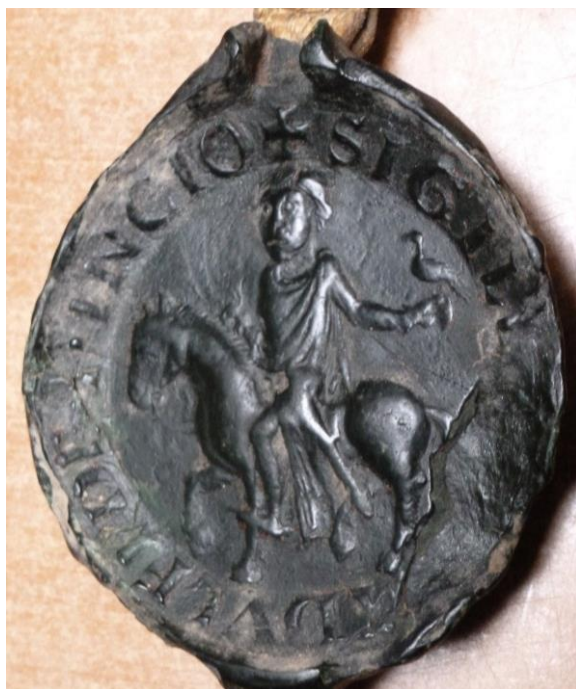
Ill. 9. – Sceau de Raoul d'Inchy, 1180 (Lille, AD Nord, 28 H 5/136).