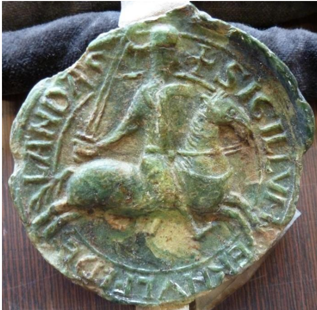
Ill. 12. – Sceau d'Arnoul 1 er de Landas, sire d'Esnes, 1193 (Lille, AD Nord, 36 H 15/246).