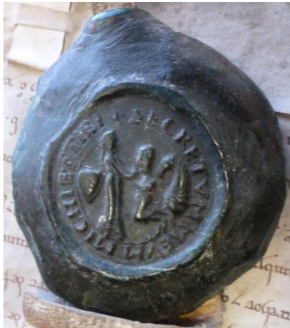
Ill. 8. – Contresceau de Gérard II, sire de Busigny et de Saint-Aubert, 1194 (Lille, AD Nord, 28 H 46/1204).