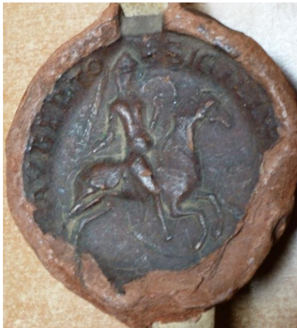
Ill. 6. – Sceau de Gilles, sire de Busigny et de Saint-Aubert, 1166 (Lille, AD Nord, f28 H 5/123).