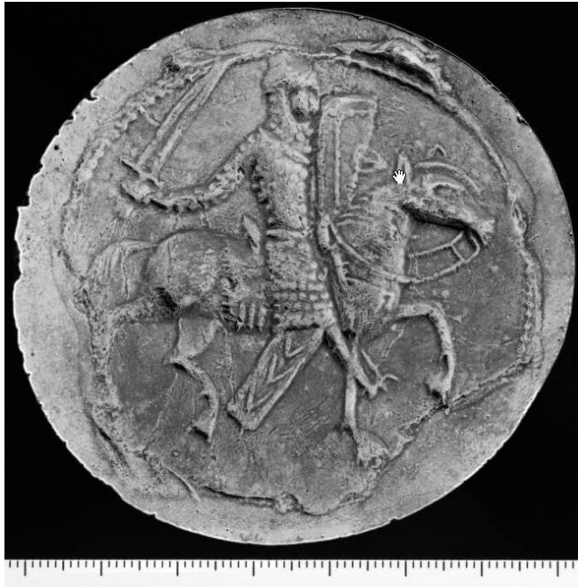
Ill. 15 – Sceau de Thierry d'Alost, [1151-1166] (Bruselles, AGR, Coll. de moulages de sceaux, n° 17822).