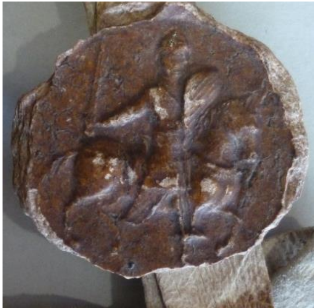
Ill. 14. – Second sceau de Baudouin IV, comte de Hainaut, 1158 (Lille, AD Nord, 1 H 9/155).