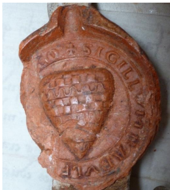
Ill. 10. – Sceau de Raoul d'Inchy, 1199 (Lille, AD Nord, 1 H 44/499).