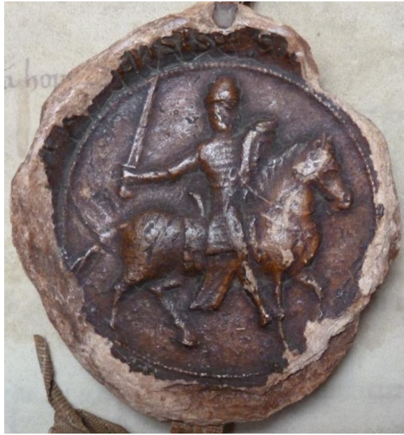
Ill. 1. – Sceau de Simon d'Oisy, châtelain de Cambrai, 1161 (Lille, AD Nord, 28 H 32/977).