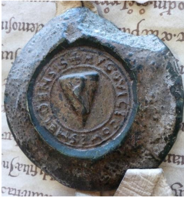
Ill. 5. – Contresceau d'Hugues III d'Oisy, châtelain de Cambrai et vicomte de Meaux, 1185 (Lille, AD Nord, 28 H 38/1060).