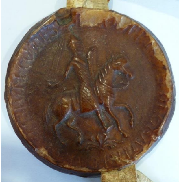
Ill. 13. – Troisième sceau de Thierry d'Alsace, comte de Flandre, utilisé dès 1142 (Lille, AD Nord, 1 H 415/3745).