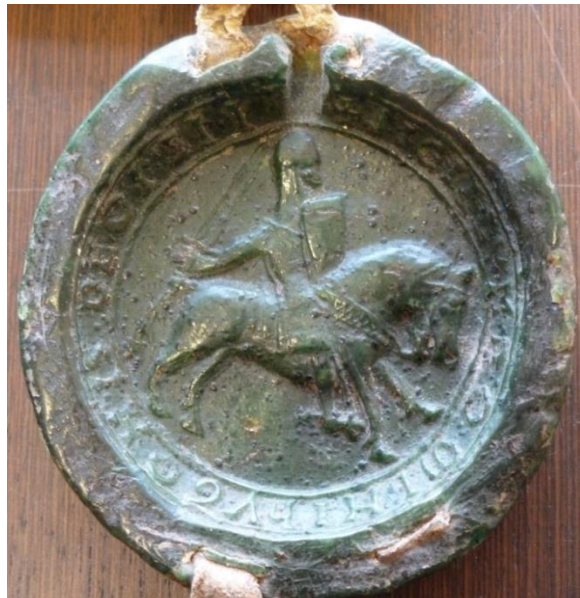
Ill. 2. – Premier sceau d'Hugues III d'Oisy, châtelain de Cambrai et vicomte de Meaux, 1170 (Lille, AD Nord, 28 H 35/1034).