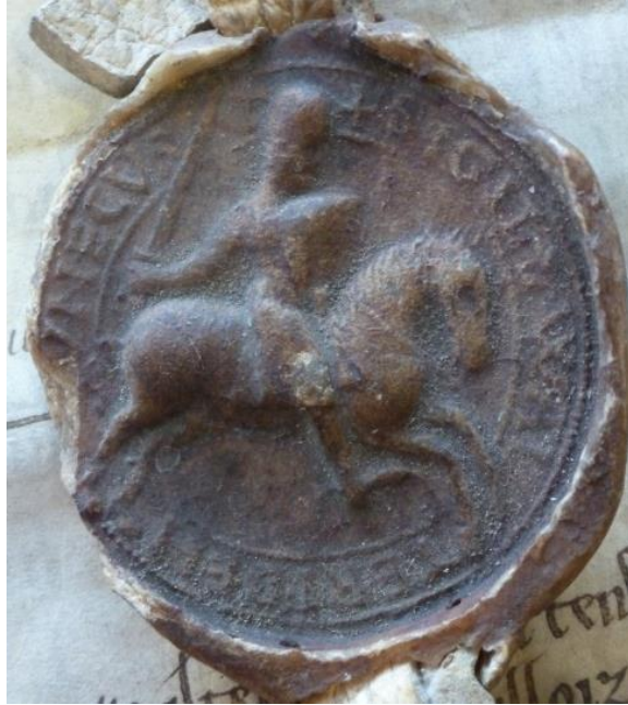
Ill. 11. – Sceau de Gautier de Honnecourt, av. 1180 (Lille, AD Nord, 28 H 38/1063).