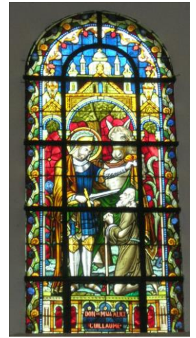
Vitrail de l'église Saint-Martin de Morialmé Tours, coupant son manteau pour le partager avec un pauvre.

Stockman, M. I., Nanoplasmonics : The physics behind the applications , Physics Today 64, 39-44, 2011.