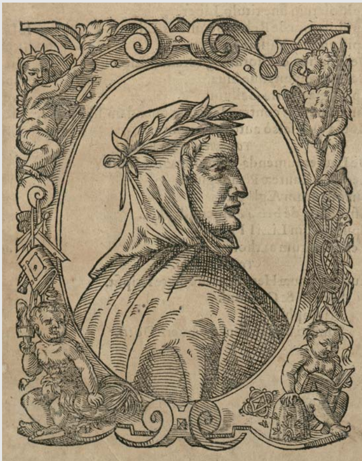
Portrait de Pétrarque issu de la page de titre de : Francisci Petrarchae, Florentini, philosophi, oratoris, et poetae clarissimi [...] Opera quae extant omnia . Bâle, 1581

Les heures passées en compagnie du « gran Tito Livio padovano » 5 , à copier, émender et méditer son texte, marquèrent de leur empreinte des pans entiers de l'œuvre de Pétrarque. En 1338 ou 1339 – une dizaine d'années après avoir entamé son travail philologique sur l' Ab Urbe condita –, il entreprend la composition d'un vaste poème latin consacré à une figure qu'il vénère depuis sa prime jeunesse : Scipion l'Africain, le héros de la deuxième guerre punique. L'épopée,