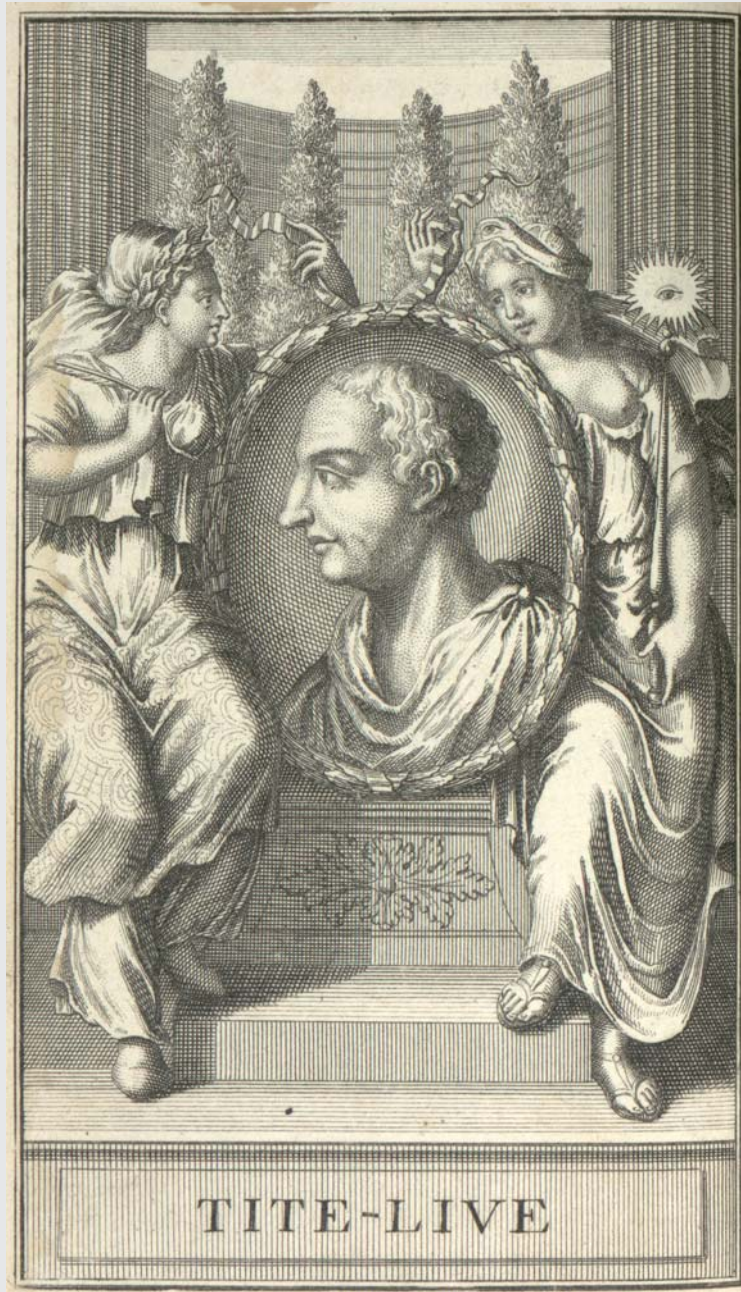
Portrait de Tite-Live issu de : Les Décades de Tite-Live. Tome I. Amsterdam, 1722