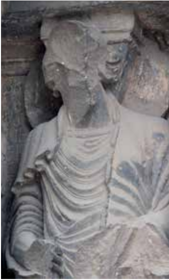
3 - Saint-Gilles-du-Gard (Gard), Saint-Gilles, façade occidentale, saint Matthieu , détail de la signature de Brunus, dernier tiers du XII e siècle.