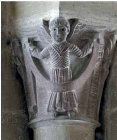
11 - Conques (Aveyron), Sainte-Foy, mur sud du transept sud, baie ouest du niveau de la tribune, chapiteau ouest, Ange tenant un phylactère avec la signature de Bernardus, fin du XI e -premier quart du XII e siècle.

Cette inscription se rapporte donc à l'image de l'Agneau divin sculpté au centre du médaillon tout en la reliant aux célébrations eucharistiques qui se déroulaient juste en-dessous. La référence visuelle et discursive à ces dernières permet ainsi à maître Gerinus d'être associé aux cérémonies sacramentelles 55 .