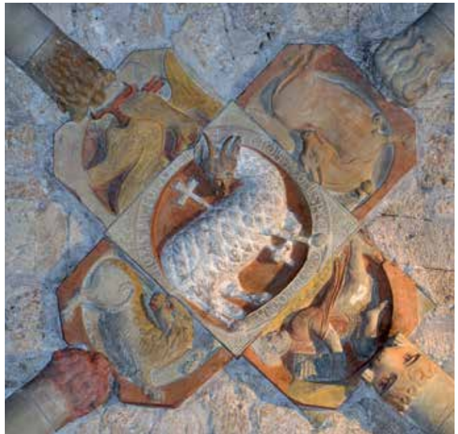
8 - Voreppe (Isère) Notre-Dame-de-Chalais, clef de voûte de la croisée du transept, Agnus Dei entouré du tétramorphe avec la signature de Gerinus, fin XII e -début XIII e siècle.

Dans cette missive, l'abbé répond, parmi d'autres sujets, à une question de Manégold sur l'orthographe de son nom, telle qu'on pouvait la lire dans l'inscription surmontant la porte de l'église de Corvey, et glisse un commentaire sur la raison pour laquelle il l'avait fait inscrire :