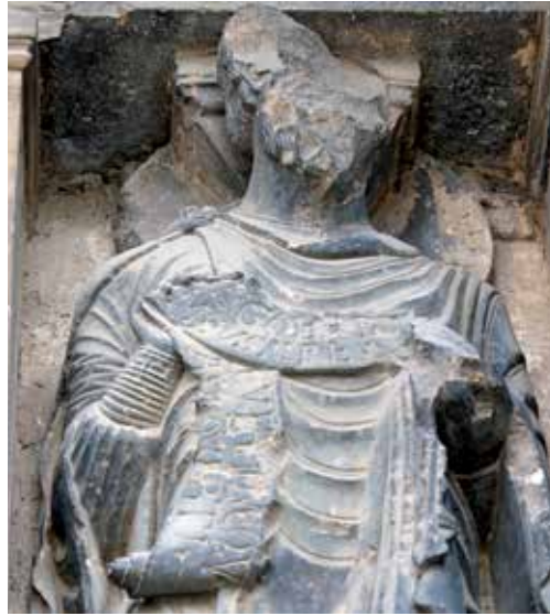
4 - Saint-Gilles-du-Gard (Gard), Saint-Gilles, façade occidentale, saint Barthélémy , détail de la signature mutilée de Brunus, dernier tiers du XII e siècle.