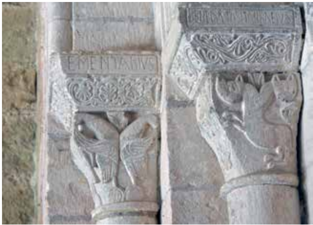
1 - Carennac (Lot), Saint-Pierre, portail occidental, chapiteaux engagés du côté nord, détail de la signature de Girbertus, fin du XI e s.