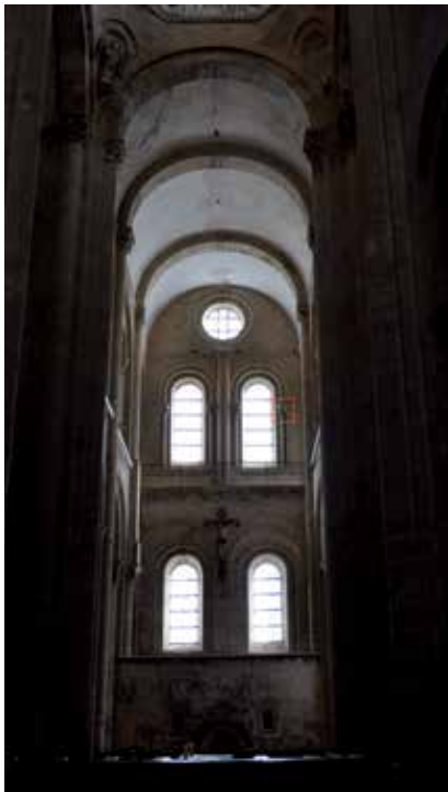
10 - Conques (Aveyron), Sainte-Foy, mur sud du transept sud.