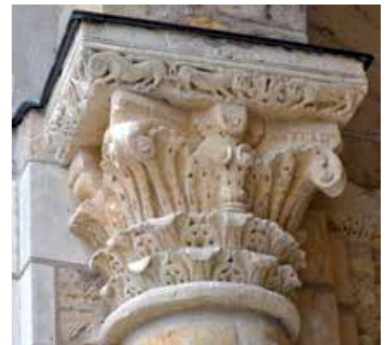
6 - Saint-Benoît-sur-Loire (Loiret), Sainte-Marie-et-Saint-Benoît, tour-porche, chapiteau avec la signature d'Unbertus, deuxième quart du XI e siècle.