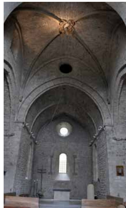
9 - Voreppe (Isère) Notre-Dame-de-Chalais, croisée du transept. Cl. É. Mineo.

En inscrivant sa signature sur la table d'autel de Saint-Sernin à Toulouse Bernard Gilduin s'associe donc à ceux dont le nom est rappelé pendant le Memento . Par l'intermédiaire de son nom gravé au fond de la coupe du ciboire, l'orfèvre limousin G. Alpais était au contact direct avec l'eucharistie. Sans être en relation physique avec l'autel, nombre de signatures épigraphiques situées dans le sanctuaire maintiennent avec celui-ci un rapport visuel et peuvent à ce titre être assimilées par extension à une inscription sur l'autel. Cette relation est particulièrement manifeste à Notre-Dame de Chalais, où maître Gerinus appose sa signature dans les écoinçons du médaillon placé à la clef de voûte surplombant jadis l'autel majeur de l'église (ill. 8 et 9). Au centre, l'image de l' Agnus Dei est entourée d'une inscription circulaire dans laquelle on lit : Agnus Dei qui tollis peccata mundi dona nobis pacem. Amen . Inspiré des mots par lesquels saint Jean Baptiste présente le Christ dans l'Évangile de Jean (Jn 29, 34), ce texte n'est autre que la citation de la formule liturgique prononcée par le célébrant après la consécration des espèces, juste avant la communion.