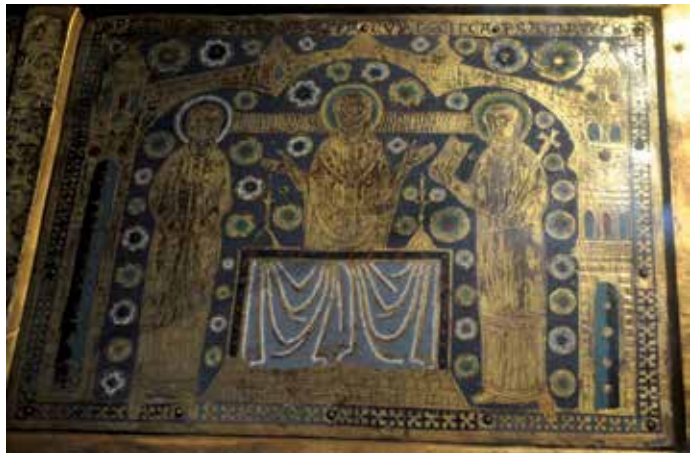
2 - Mozac (Puy-de-Dôme), Saint-Pierre-et-Saint-Caprais, Châsse-reliquaire de saint Calmin, détail du panneau avec la signature de l'abbé Pierre, fin du XII e siècle.

Les occurrences signalant explicitement la qualité d'artiste du signataire sont donc l'exception plutôt que la norme. Il est tout aussi difficile d'inférer avec certitude ce statut à partir des verbes auctoriaux car, dans la très grande majorité des cas, il s'agit de facere . L'amplitude sémantique de ce verbe ne permet pas de caractériser finement l'action revendiquée dans la signature, surtout lorsque l'œuvre est évoquée en des termes vagues au moyen de déictiques, tels les pronoms me ou hoc : placé sur un élément architectural décoré, tel un chapiteau ou un tympan, il peut tout aussi bien renvoyer à la réalisation de la sculpture que de l'architecture, voire des deux à la fois. En outre, la possibilité de le traduire par « faire » ou par « faire faire » participe à entretenir un doute sur le degré d'implication du signataire dans la fabrication matérielle de l'œuvre 27 . Dans quelques cas, comme celui de la châsse de Saint-Calmin à Mozac où l'on peut lire « Petrus abbas Mauziacus fecit capsam precio(sam) » (Pierre, abbé de Mozac a fait [cette] châsse précieuse) bien que le verbe auctorial soit à la forme active, le signataire n'est manifestement pas celui qui a exécuté l'œuvre de ses mains, mais plutôt celui qui en a ordonné l'exécution 28 , que l'on doit à un atelier limousin (ill. 2).