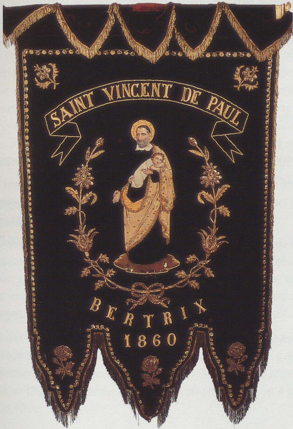
Bannière de la conférence de Saint-Vincent de Paul, de Bertrix. Velours brodé, 2 e moitié du XIX e siècle, provenant de l'église Saint-Etienne, Bertrix.

A différentes reprises, des conférences se plaignent du manque ou du très petit nombre de pauvres , dans lesquels elles voient un de leurs plus grands obstacles . Il est vrai que dans les campagnes, où les structures familiales demeurent plus cohérentes,