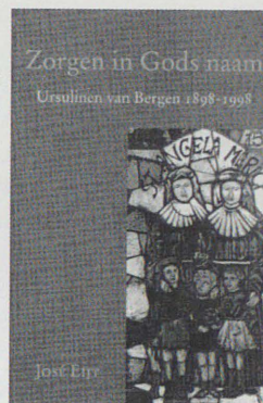
De Nederlandse studies geven de voorrang aan de levens- en geloofservaring van de kloosterzusters.

Op methodologisch vlak pakten de Nederlandse historici (en vooral historicae) de zaken grondig aan. Twee hoofdgedachten waren het uitgangspunt. Hoe zicht krijgen op de motivaties van de zusters, hun levens- en geloofservaringen, de zingeving van hun apostolaat, de manier waarop ze zichzelf zagen en hun omgeving waarnamen? Hoe ook verslag uitbrengen over de onvermijdelijke verscheidenheid van omstandigheden en benaderingen, naargelang van sociale afkomst, leeftijd, vorming, taken en verantwoordelijkheid van de protagonisten? Om die twee doelstellingen te bereiken werd een werkwijze gehanteerd waarin zowel onderzoek van archief- en gedrukte bronnen als oral history aan bod kwamen. 25 Waarschijnlijk is dit het geval voor de twee laatste derden, ja zelfs de laatste helft van de twintigste eeuw. Dit alles neemt niet weg dat de mondelinge bronnen en geschreven getuigenissen ex post door de zusters verschaft veel meer aanbieden dan illustra-