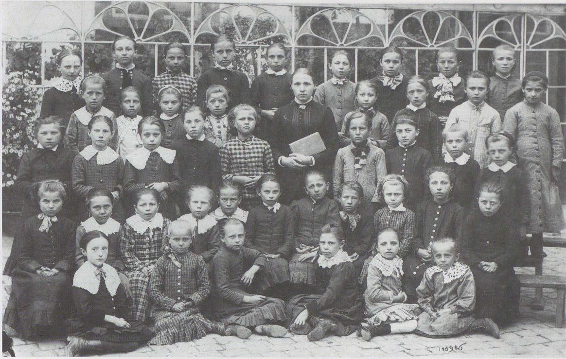
L'école primaire des sœurs de Notre-Dame de Bastogne en 1886.

gieux, tout en dépassant les six dixièmes chez les religieuses. Le personnel des ordres et congrégations implantés en Luxembourg se contracte peu à peu, à partir de 1920, lorsque les exilés commencent à rentrer dans l'Hexagone 8 . Toutefois, le départ des Français et des Françaises est partiellement compensé par une augmentation du recrutement en Belgique. En 1947, la répartition des communautés masculines et féminines entre les arrondissements administratifs, héritée du demi-siècle précédent, est assez différente selon les sexes : les concentrations les plus fortes se situent dans l'arrondissement d'Arlon pour les religieux, en Gaume pour les religieuses.