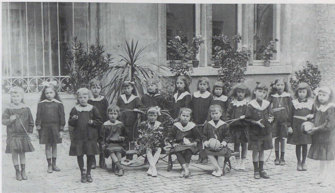
Institut des sœurs de Notre-Dame : l'école primaire dans les années 1910.

premier est due au frère Théophile, supérieur général (1883-1907) : pressentant la levée d'une tempête contre les congrégations en France, l'intéressé prépare des havres d'accueil dans les pays voisins, afin de pouvoir y former des jeunes religieux. Outre des classes primaires, puis une école secondaire, la maison d'Arlon accueille un noviciat (1888) et une école normale primaire (1890), avant de créer une « régence » (école normale secondaire, 1944). Aux communautés belges de l'institut, cette succursale « fournit régulièrement un bon contingent de frères diplômés » 36 . Bien plus, « de l'école normale, agréée par l'État, sort une pléiade de bons instituteurs chrétiens, qui enseignent surtout dans les écoles rurales du Luxembourg » 37 . Juvénat à l'origine, la maison de Habay permuta sa fonction initiale avec celle de Mont-Saint-Guibert, en Brabant wallon : elle accueille le noviciat belge de l'institut 38 .