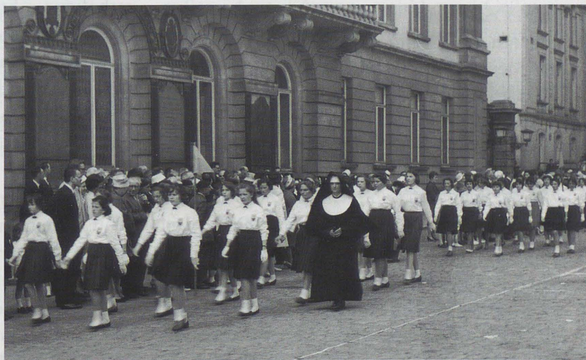
Le défilé du 100 e anniversaire de l'Institut des sœurs de Notre-Dame d'Arlon.

Fondées en 1806, à Hotviller, par Antoine Gapp, les sœurs de la Providence – dites de Saint-André – de Peltre 46 prennent pied en Luxembourg via des localités frontalières marquées par l'influence culturelle de la France. Elles y tiennent sept écoles avant 1879. Elles