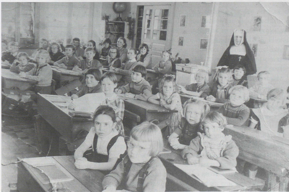
Une religieuse enseignante et sa classe. 1 re moitié du XX e siècle. Coll. privée.

Il est malheureusement impossible de déterminer, à l'unité près, le nombre de frères et de sœurs engagés jadis dans l'éducation des