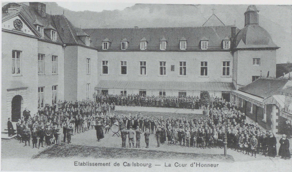
Etablissement de Carlsbourg : la cour d'honneur. Carte postale colorisée éditée par A. Breger frères à Paris, 1905.