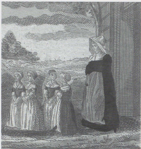
Sœur de la Charité allant à la promenade avec ses petites écolières

Sœur de la Charité allant à la promenade avec ses petites écolières. Au verso : « Prix d'aptitude Thérèse Nopener 14 février 1834 ».