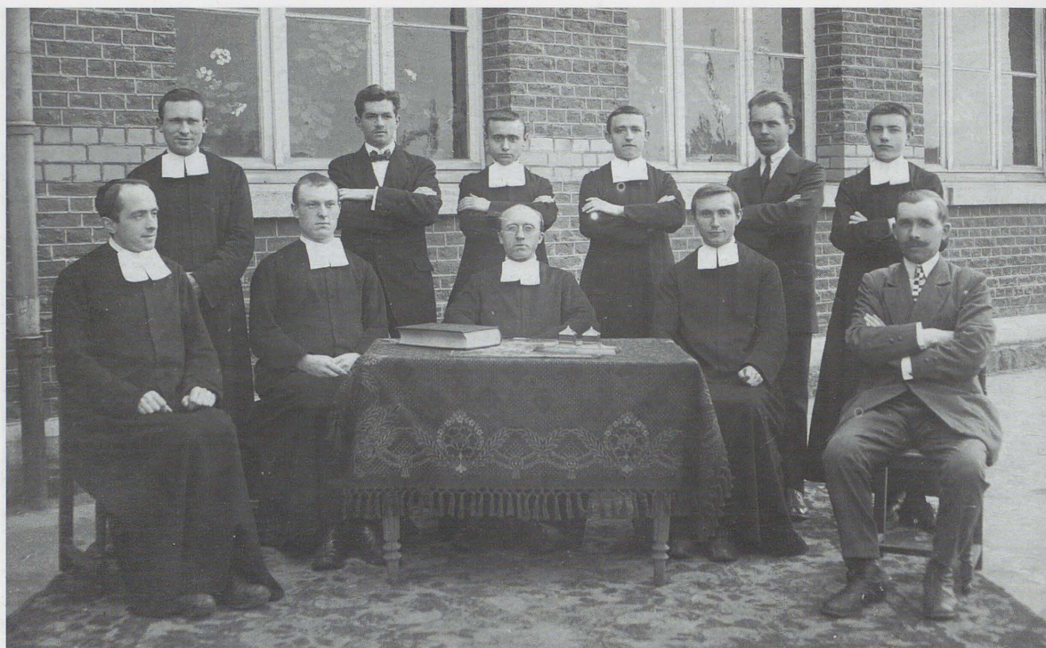
Les frères des Écoles chrétiennes de Bastogne : l'équipe enseignante de l'année scolaire 1917-1918.

Troisième République retirent à l'institut son statut de congrégation légalement reconnue. De nombreux frères s'expatrient alors, pour fonder des maisons à l'étranger 30 . Le pensionnat de Beaugard à Longuyon trouve ainsi refuge à Hachy (1904-1940), tandis que le juvénat d'Étain se fixe à Sterpenich (1905-1919) 31 . En 1920, à l'apogée de leur présence en Luxembourg belge, on compte une centaine de frères des Écoles chrétiennes dans la province 32 .