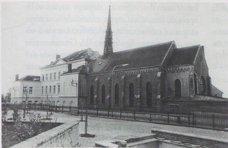
L'Institut des sœurs de Notre-Dame d'Arlon : les bâtiments scolaires arrimés à la chapelle en 1961.

titutrices : jusqu'au fléchissement des vocations, celles-ci sont, pour la plupart, des aspirantes à la vie religieuse. L'établissement se double, en 1895, d'un institut froebélien (école normale gardienne). Il fonctionne jusqu'en 1985, année au cours de laquelle la restructuration de l'enseignement pédagogique entraîne sa fermeture 42 .