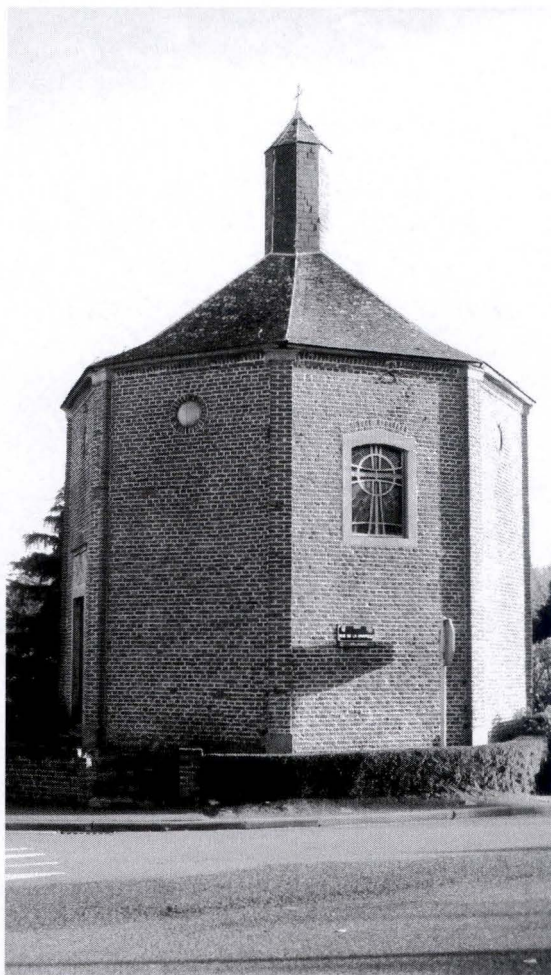
Chapelle Notre-Dame de Bonne-Espérance (1820) à Thorembais-Saint-Trond, chaussée de Gembloux

C. DELOOZ, À la découverte de l'entité de Perwez , Lonzée, 2001, p. 32 et 34 ; J. TORDOIR, Les grandes figures du Brabant wallon. 5 : Jules Brabant (1845-1908). Fermier d'Arenberg, exploitant de la ferme de Jausselette à Perwez, député de l'arrondissement de Nivelles , Incourt, 1994.