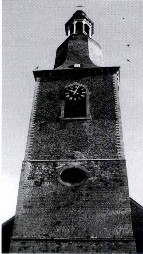
Le clocher de l'église Saint-Martin de Pervez

riches sont libérales et nos agriculteurs, assez tenaces, donnent difficilement pour les bonnes œuvres, surtout quand ils ont la perspective de s'engager pour plusieurs années. Dans l'immédiat, la seule solution est de collecter à domicile.