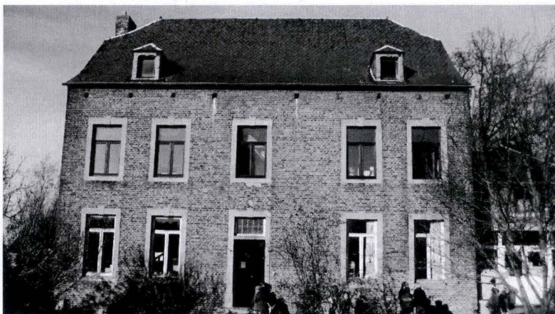
L'ancien presbytère de Thorembais-les-Béguines (fin 18 e s.) dans lequel les religieuses ont logé, accueillant aujourd'hui les classes maternelles de l'école communale.

en assure l'essentiel du financement. Après avoir quitté l'enseignement communal, les deux sœurs passent à la tête de nouvelles classes, tout en logeant temporairement à la cure. Tenue par une institutrice, l'école laïque 49 leur fait concurrence : la population scolaire qu'elles instruisent tombe de 96 élèves, en 1878, à 76, en 1880 50 .