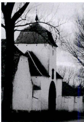
Le porche de la ferme de Mellemont (milieu du 18 e s.) à Thorembais-les-Béguines, autrefois propriété de l'abbaye de Villers-la-Ville.