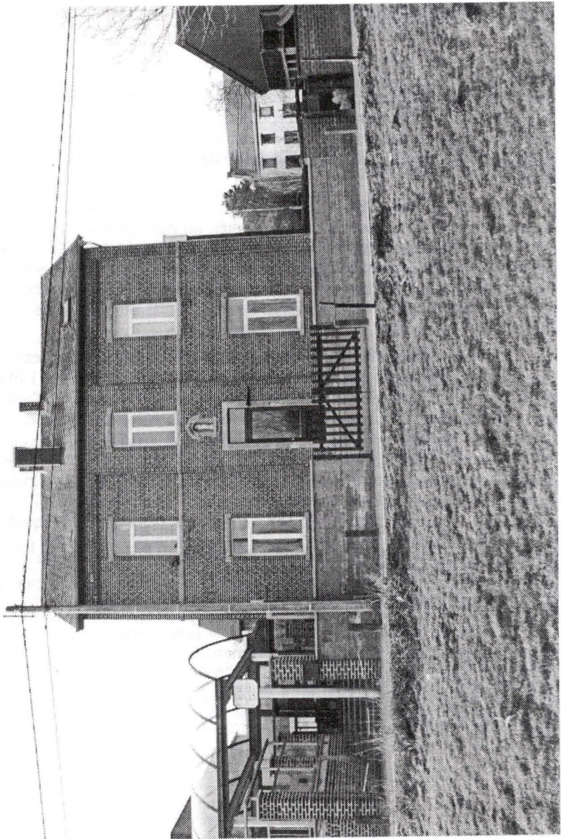
L'école des sœurs de la Providence à Gentinnes construite en 1893 par la comtesse de Limminghe (Photo de M.-A. Collet, mars 2004)