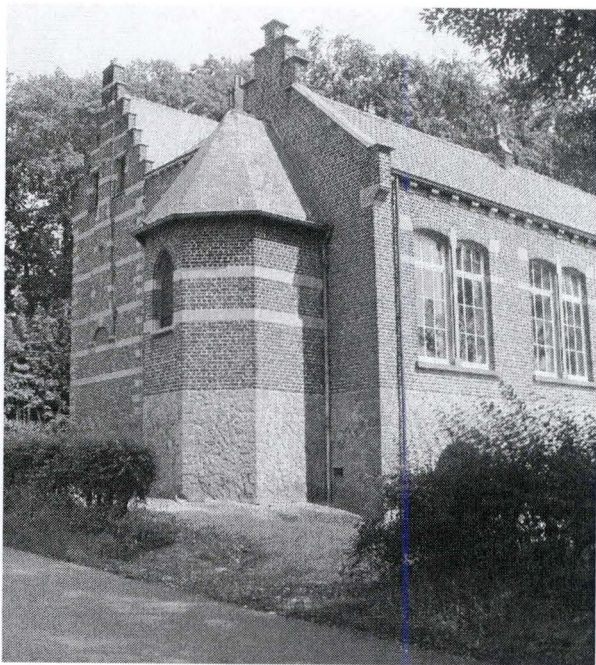
L'école catholique de Vieusart (Photo de M.-A. Collet, 2006)

À première vue, le passé du couvent de Vieusart n'incite guère à une réflexion sur les clivages qui traversent la société belge, notamment dans le champ clos de l'enseignement 44 . Cependant, il invite les historiens à étendre les investigations sur le mécénat des notables catholiques et ce sous quatre angles d'attaque.