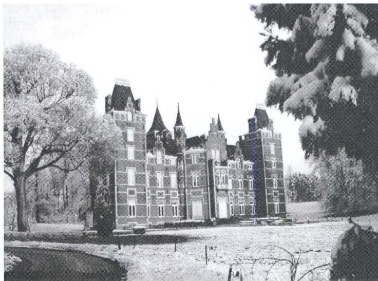
Le château de Vieuxart construit par l'architecte J.-P. Cluysenaer en 1858 (Photo de A. de Dorlodot-Dorjo, 2007)

Bruxelles, mais aussi les châteaux de Viron à Dilbeek et celui d'Argenteuil. L'édifice, considéré à l'époque comme luxueux, est une ample construction de 45 mètres de long et de 25 mètres de profondeur, bâtie en briques, avec anglées et cordons en pierre blanche. La façade sud-ouest est flanquée à chaque extrémité d'une tour carrée. Au-dessus de la toiture s'élançant de nombreuses tourelles. De beaux massifs et de grandes pelouses encadrent des étangs. Le tout forme, selon Cosyn, un « superbe ensemble » 17 , qui a « encore un aspect seigneurial ». C'est dans cette très belle demeure que réside la fondatrice de l'école de Vieuxart.