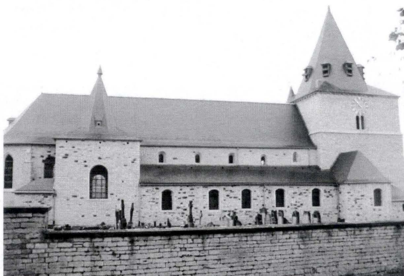
L'église Saint-Martin de Tourinnes-la-Grosse, classée depuis 1946, après les travaux de restauration (2008-2010)