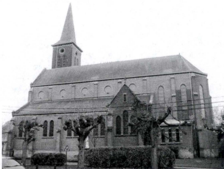
L'église Notre-Dame de Walhain, édifice néo-gothique de 1897 (Photo de M.-A. Collet, novembre 2010)

des écoles paroissiales. Le desservant table sur le concours de son confrère de Saint-Paul, A.-J. Higuët 28 , sur un apport de l'abbé Michaux 29 , vicaire et neveu du précédent, et sur l'aide de quelques personnes de la paroisse 30 . C'est donc le clergé local, dont certains membres sont assez fortunés 31 , qui supportera l'essentiel des dépenses correspondantes.