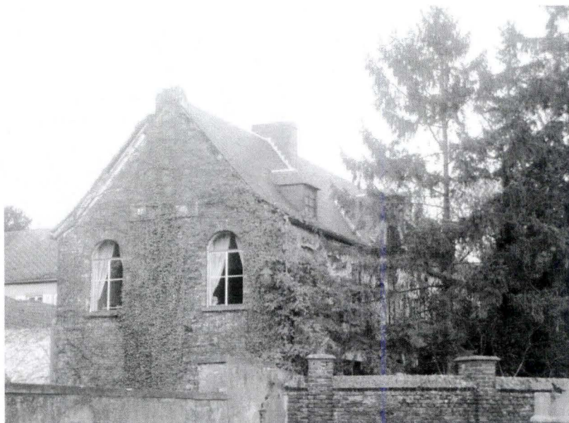
Ancienne vicairie de Tourinnes-la-Grosse (18 e -19 e s.), à gauche de l'église. La maison communale, et sans doute aussi l'école des sœurs, y ont été hébergées.

L'école est adoptée par la commune. Elle compte deux classes primaires desservies, depuis 1852, par autant de sœurs de la Providence 4 . En 1860, à la demande de la députation permanente du Brabant, une convention est passée entre la commune et les supérieurs de la congrégation, afin de spécifier les droits et devoirs des parties 5 . À cette occasion, on apprend que les religieuses reçoivent le logement avec jardin, le gros mobilier et un traitement annuel fixe de 350 francs par personne. S'y ajoutent 50 francs pour