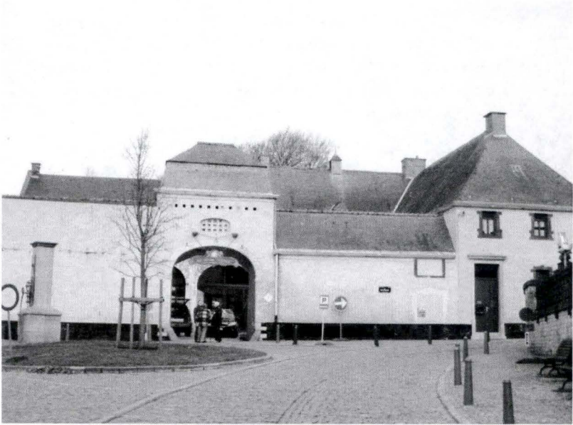
Le presbytère de Tourinnes-la-Grosse (ancienne ferme du 18 e s.)

sera confié ultérieurement à une enseignante laïque 10 . En 1879, en pleine guerre scolaire, la commune nommera une ancienne congréganiste, la ci-devant sœur Alphonsine, au poste d'institutrice gardienne 11 . Aucune communauté religieuse ne prend le relais des sœurs de la Providence dans la localité 12 .