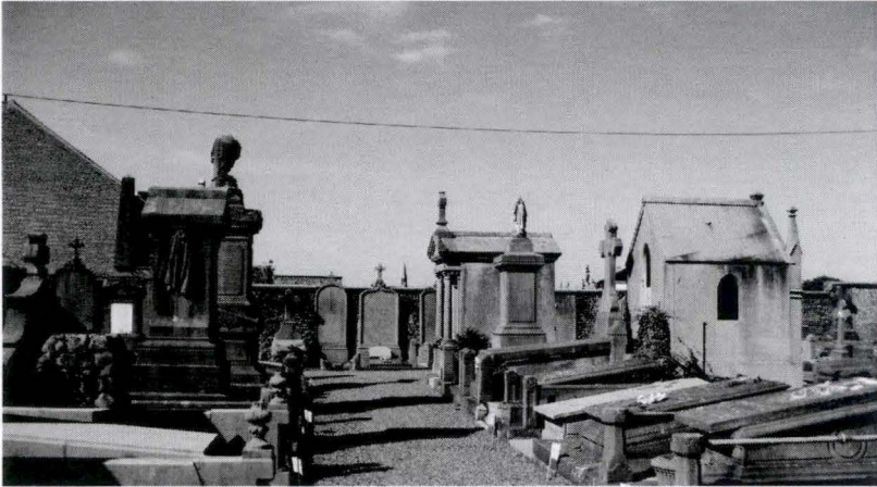
Cimetière de Nivelles, allée G2

L'arrêt de la Cour d'appel est rendu le 21 janvier suivant. Il condamne Jules de Burlet à 100 francs d'amende. Les attendus soulignent que le prévenu ne pouvait ignorer la loi, ni les arrêts de la Cour de Cassation et qu'il n'a pas obtempéré à deux injonctions de la tutelle 48 .