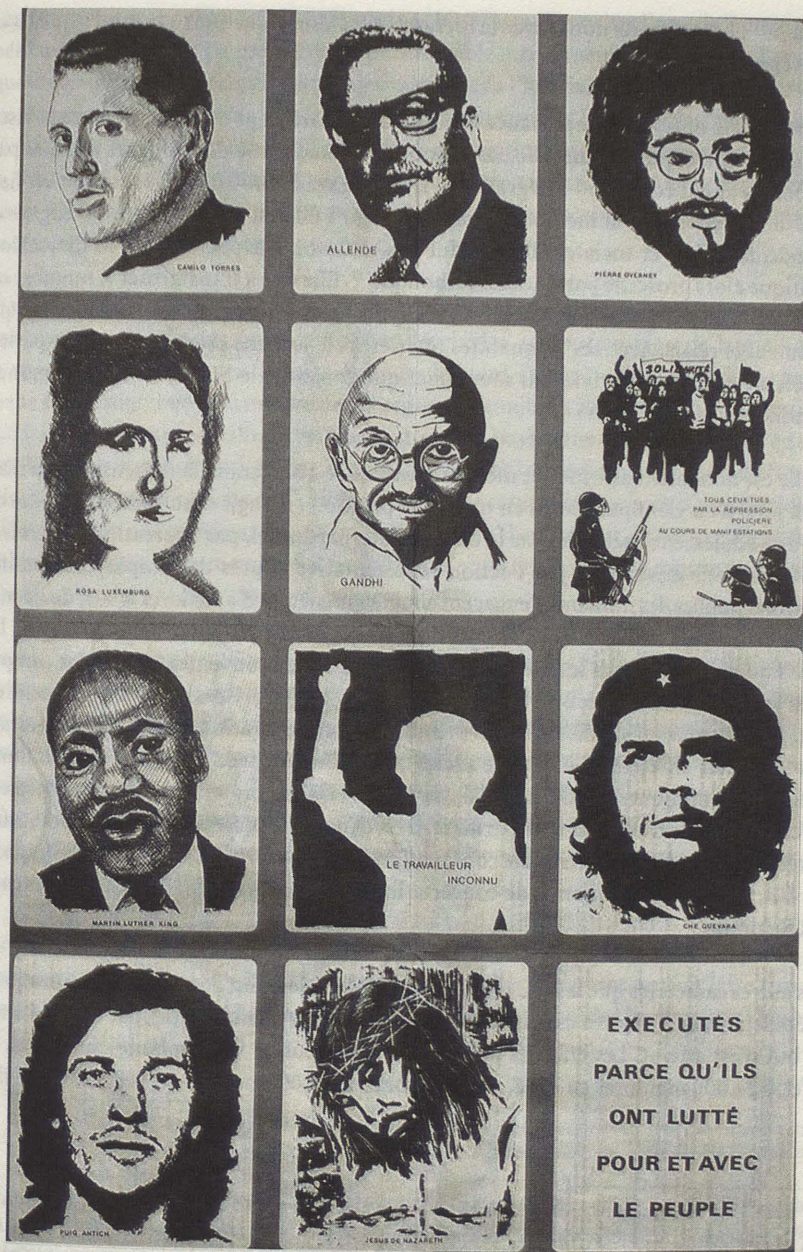
• "Super Poster des luttes ouvrières". Galerie de portraits d'anciennes et de nouvelles idoles de la JOC : Camilo Torres, Allende, Pierre Overney, Rosa Luxemburg, Gandhi, Martin Luther King, Che Guevara, Puig Antich et Jésus de Nazareth. Sont également mis à l'honneur "tous ceux tués par la répression policière au cours de manifestations" ou "parce qu'ils ont lutté pour et avec le peuple". Sans date, après la mi-1974.