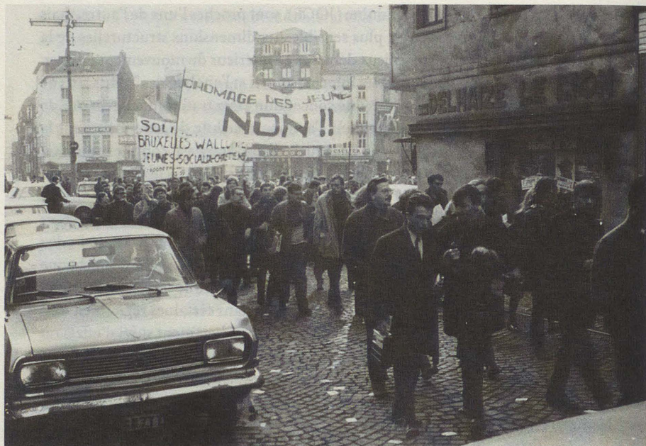
• "Bruxelles, 11 mars 1969. Marche antiatomique des jeunes". Des calicots protestent contre le chômage des jeunes et prônent la solidarité entre Bruxelles et la Wallonie.

par une sorte de dépannage individuel. Il faut s'attaquer aux racines du mal. Dès lors, le but à atteindre est "la transformation radicale des structures de la société" 18 , dans un sens qualifié d'anticapitaliste, puis de socialiste. Dans la pratique, cependant, le mouvement éprouve de grosses difficultés à préciser ses options, plus encore à mettre au point une stratégie cohérente afin de les concrétiser. Des années durant, il donne l'impression de tâtonner, parfois même de tourner en rond en s'enfermant dans un discours circulaire.