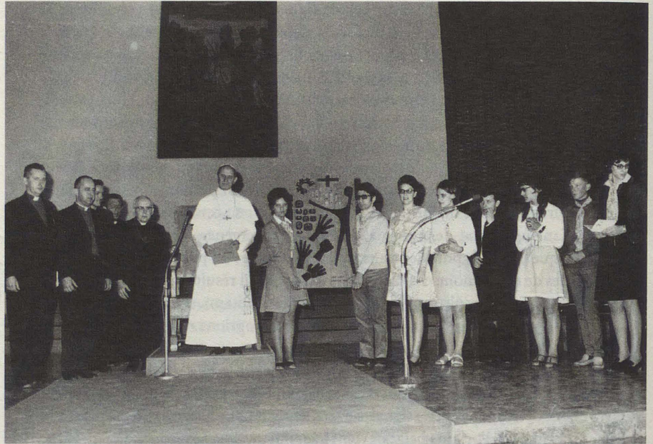
• "1970. Rome, pèlerinage JOC/F". Malgré les critiques croissantes vis-à-vis des autorités ecclésiastiques, une délégation de la JOC/F se rend à Rome où elle est reçue par le pape Paul VI.

familles qui, par antifascisme, entretiennent une tradition de radicalisme politique 38 . La plupart d'entre eux ont connu les mécanismes d'exclusion ou de relégation par l'enseignement : les inégalités socio-culturelles ont exercé une influence profonde sur leur trajectoire scolaire, puis sur leur itinéraire professionnel 39 . Dans la vie de travail, ils se concentrent généralement dans des entreprises nouvelles, créées par des sociétés multinationales. Y sévissent la parcellisation des tâches, la tyrannie des petits chefs et des pointeuses. On y rencontre aussi certaines formes de pragmatisme syndical axées sur les revendications quantitatives, moyennant le respect de clauses de paix sociale,