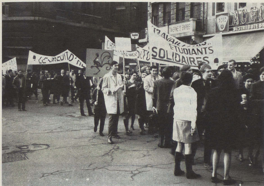
• "Bruxelles, 11 mars 1969. Marche antiatomique des jeunes". Les banderoles plaident notamment pour la solidarité entre travailleurs et étudiants. (Photo Archives de la JOC).

exagérément violent et à nets relents corporatistes : elle serait le fait de jeunes bourgeois qui, après avoir viré leur cuti, pourraient devenir des adversaires de la classe ouvrière 29 . Il faut attendre mars 1969 pour que des porte-parole de la JOC commencent à assimiler attitude contestataire et possibilité de transformer la société. C'est durant l'été 1969 que leurs réticences initiales s'estompent définitivement : "Les jeunes travailleurs, affirment-ils, participent au mouvement de contestation propre à toute la jeunesse de nos pays occidentaux" 30 .