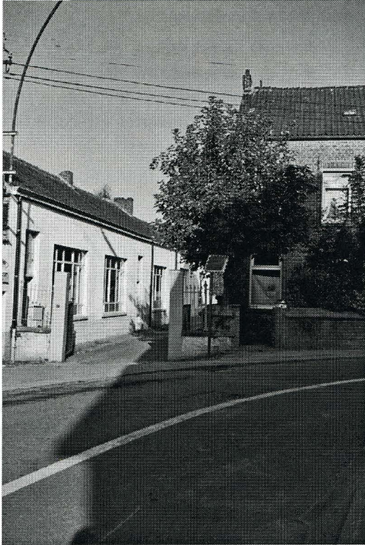
L'école et la maison des sœurs, au chemin du Croly à Quenast

plafond des 200. Il faut alors créer une troisième classe primaire, bâtie aux frais de la famille Clément. Il est également nécessaire d'envoyer sur place une religieuse supplémentaire. Le succès change de camp 31 .