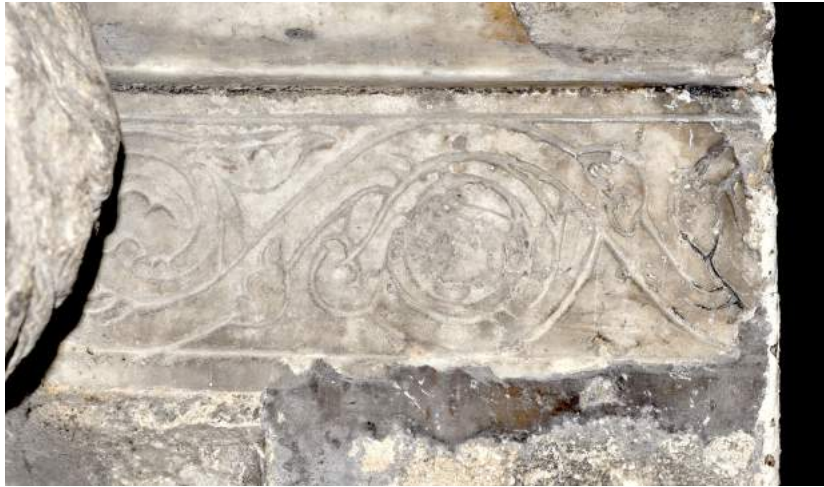
Fig. 5. Rinceau (détail de l'inscription de Willemus Martini), Vienne (Isère), Saint-André-le-Bas, côté sud de la nef, socle de pilier engagé, vers 1152 © Photo: Emilie Mineo.

La qualité formelle d'une réalisation épigraphique n'est pas la condition nécessaire ou suffisante pour apprécier la capacité à écrire de l'artiste. Vers le milieu du XII e siècle, un certain Hernaodus a laissé son nom dans une inscription au texte assez développé et en vers sur le portail nord de l'église Saint-Martin à Ardentes (DEBIAIS et al. , 2014, 25, Indre, n°1, p. 17-18) (fig. 6). L'ambition littéraire du choix de la forme métrique contraste avec la qualité esthétique de l'exécution graphique: la mise en page y est assez sommaire et l'écriture irrégulière. Si le scripteur avait eu un modèle à reproduire, la forme des lettres aurait probablement été plus constante. À mon sens, l'inscription a été réalisée par une personne qui savait écrire (même si à un niveau assez élémentaire) mais qui n'avait pas l'habitude de le faire avec cette technique. 9 Un rapport occasionnel à l'écrit épigraphique expliquerait le caractère approximatif de l'écriture.