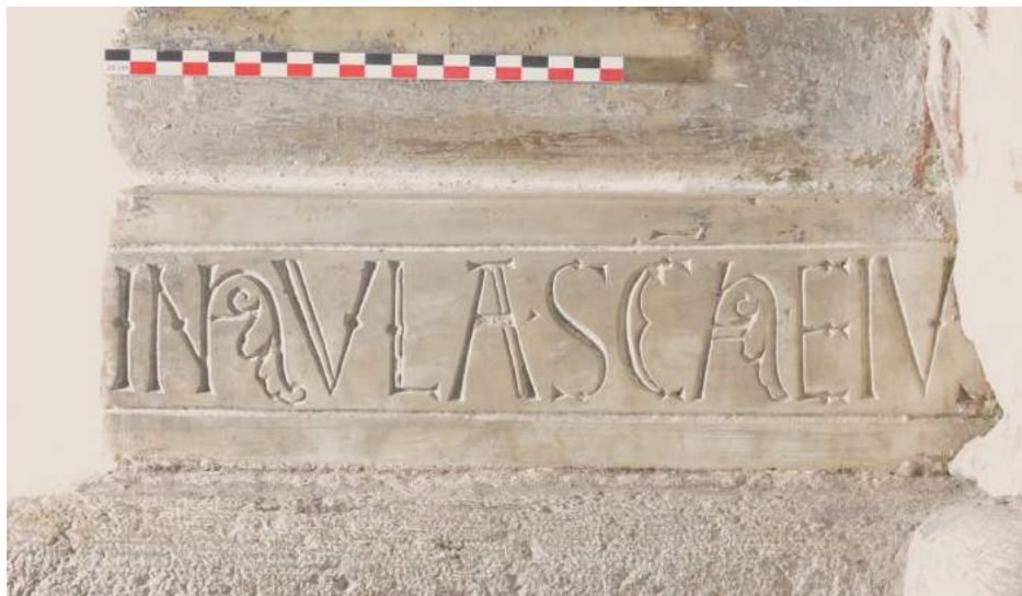
Fig. 3. Inscription avec la signature de Wilelmus Martini , vers 1152, Vienne (Isère), Saint-André-le-Bas, côté sud de la nef, socle de pilier engagé © Photo: Emilie Mineo.

Même si on ne peut prouver qu'il fut également l'auteur de la composition textuelle savante accompagnant la signature, il ne fait pas de doute que le lapicide savait écrire. On observe en effet la maîtrise parfaite de la technique de l'incision des lettres, avec profil en V, l'élégance et l'extrême régularité de la forme des lettres (en particulier des A, D, O en navette, et surtout des R), un équilibre remarquable de la mise en page. Non seulement celui qui a réalisé cette inscription était un expert "calligraphe lapidaire", mais l'écriture d'apparat des manuscrits faisait sûrement partie de sa culture graphique et visuelle, comme le prouvent les beaux A fleuris dans aula et sancta (fig. 4) et —détail jusqu'à présent passé inaperçu— la frise qui couvre la dernière section du pilier, anépigraphhe (fig. 5). 8