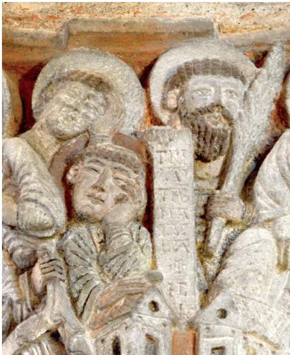
Fig. 12. Transfiguration du Christ (détail de l'inscription), second tiers du XII e siècle, Saint-Nectaire (Puy-de-Dôme), Saint-Nectaire, chapiteau du chœur © Photo: Emilie Mineo.

Plusieurs cas de figure sont donc envisageables: l'artiste ne sachant pas écrire et reproduisant des lettres en tant que formes, par imitation; celui sachant transposer un texte en lettres monumentales, avec des résultats de qualité variable; celui sachant composer un texte par lui-même; celui maîtrisant l'art calligraphique; celui agençant ensemble écriture et image de manière originale et méditée. On peut les rapprocher des catégories élaborées par Armando Petrucci pour distinguer ceux qui ne savent absolument ni lire ni écrire ( analfabeti ), ceux dont les compétences graphiques permettent à peine d'écrire des textes très courts et presque jamais de lire ( semialfabeti grafici ), ceux dont la capacité à lire et à écrire se limite à des contextes bien précis et demande un certain effort ( semialfabeti funzionali ), ceux qui se servent de l'écriture (production ou reproduction écrite) dans le cadre de leur activité professionnelle ou pour les besoins de la communication courante ( alfabeti dell'uso ) (PETRUCCI, 2004, p. 20-21).