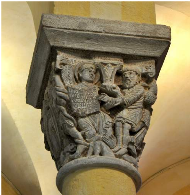
Fig. 9. Stefanus offrant un chapiteau avec inscription de donation , second quart du XII e siècle, Clermont-Ferrand (Puy-de-Dôme), Notre-Dame-du-Port, chapiteau du chœur © Photo: Emilie Mineo.