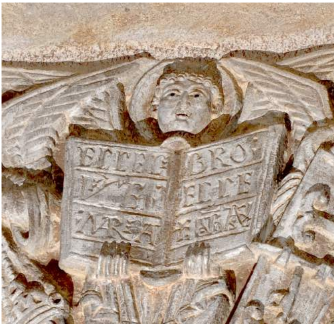
Fig. 10. Ange tenant le Livre de Vie , second quart du XII e siècle, Clermont-Ferrand (Puy-de-Dôme), Notre-Dame-du-Port, chapiteau du chœur © Photo: Emilie Mineo.