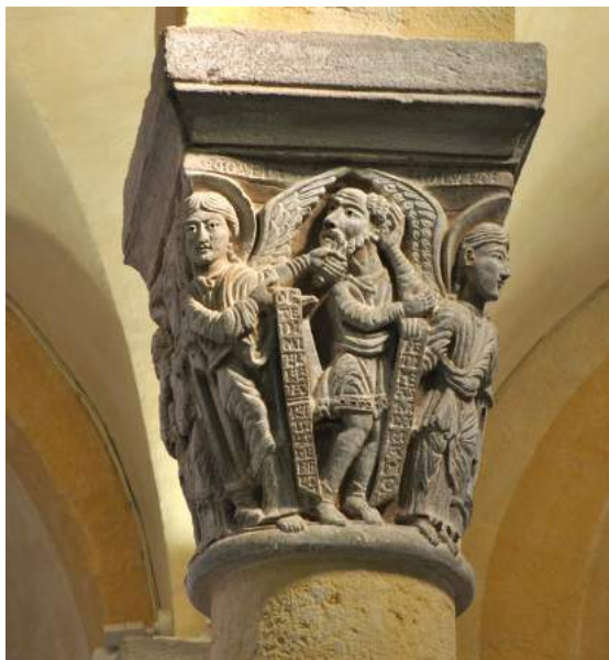
Fig. 8. Apparition de l'ange à Joseph avec la signature de Rotbertus, second quart du XII e siècle, Clermont-Ferrand (Puy-de-Dôme), Notre-Dame-du-Port, chapiteau du chœur