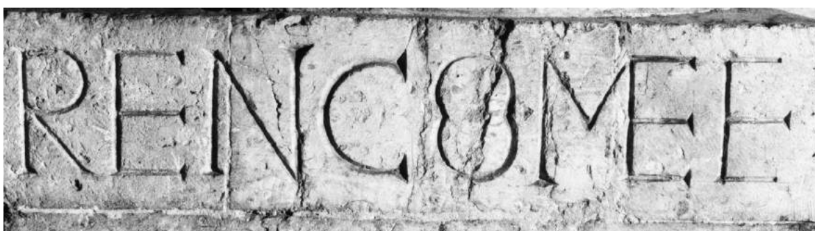
Fig. 2. Signature de Renco (détail), XII e siècle, Tournus (Saône-et-Loire), Saint-Philibert © CI-FM/J. Michaud.

Des situations d'analphabétisme intégral ont donc vraisemblablement existé, mais elles ne devaient pas être la règle générale car on rencontrerait un nombre beaucoup plus élevé d'erreurs dans la forme des lettres des inscriptions conservées. De plus, cette hypothèse impliquerait le recours systématique à un tiers, le fameux ordinator , 5 qui, présent dans toutes les occasions où il fallait produire une inscription, avait une culture graphique telle qu'elle lui permettait de convertir une minute manuscrite en modèle épigraphique. Pour réaliser l'inscription, un scripteur analphabète ou illettré avait en effet besoin soit d'un modèle dessiné sur un autre support (HIGGITT, 1988, p. 151), soit d'un patron à l'échelle, soit du traçage préliminaire des lettres sur la surface à inscrire. Le premier moyen, s'il a été utilisé, n'avait pas vocation à être conservé après