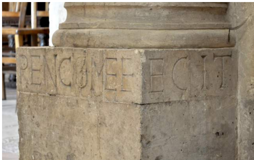
Fig. 1. Signature de Renco , XII e siècle, Tournus (Saône-et-Loire), Saint-Philibert, socle de pilier situé à l'angle entre le bas-côté et le bras sud du transept

cette même ligne, ce qui a conduit à agrandir la taille de l'empatement pour que la lettre occupe en vertical tout l'espace qui lui était alloué. Ces irrégularités dans la forme des lettres ainsi que la gestion imparfaite de la mise en page laissent supposer que le lapicide était analphabète, ou, du moins, qu'il maîtrisait imparfaitement l'alphabet et la technique d'écriture sur pierre.