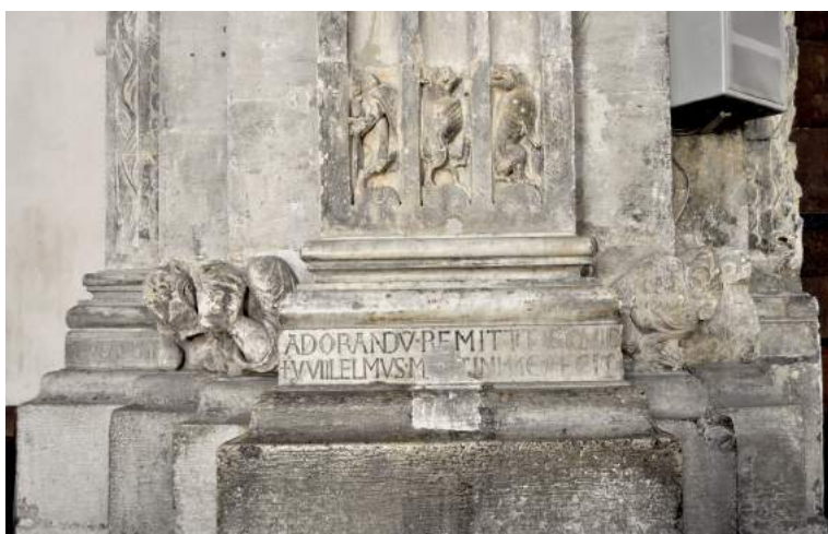
Fig. 4. Inscription avec les mots Aula sancta (détail de l'inscription de Wilelmus Martini), vers 1152, Vienne (Isère), Saint-André-le-Bas, côté sud de la nef, socle de pilier engagé © Photo: Emilie Mineo.

Même si on ne peut prouver qu'il fut également l'auteur de la composition textuelle savante accompagnant la signature, il ne fait pas de doute que le lapicide savait écrire. On observe en effet la maîtrise parfaite de la technique de l'incision des lettres, avec profil en V, l'élégance et l'extrême régularité de la forme des lettres (en particulier des A, D, O en navette, et surtout des R), un équilibre remarquable de la mise en page. Non seulement celui qui a réalisé cette inscription était un expert "calligraphe lapidaire", mais l'écriture d'apparat des manuscrits faisait sûrement partie de sa culture graphique et visuelle, comme le prouvent les beaux A fleuris dans aula et sancta (fig. 4) et —détail jusqu'à présent passé inaperçu— la frise qui couvre la dernière section du pilier, anépigraphhe (fig. 5). 8