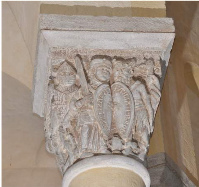
Fig. 11. Caritas en armes affrontant Avaritia , second quart du XII e siècle, Clermont-Ferrand (Puy-de-Dôme), Notre-Dame-du-Port, chapiteau du chœur © Photo: Emilie Mineo.