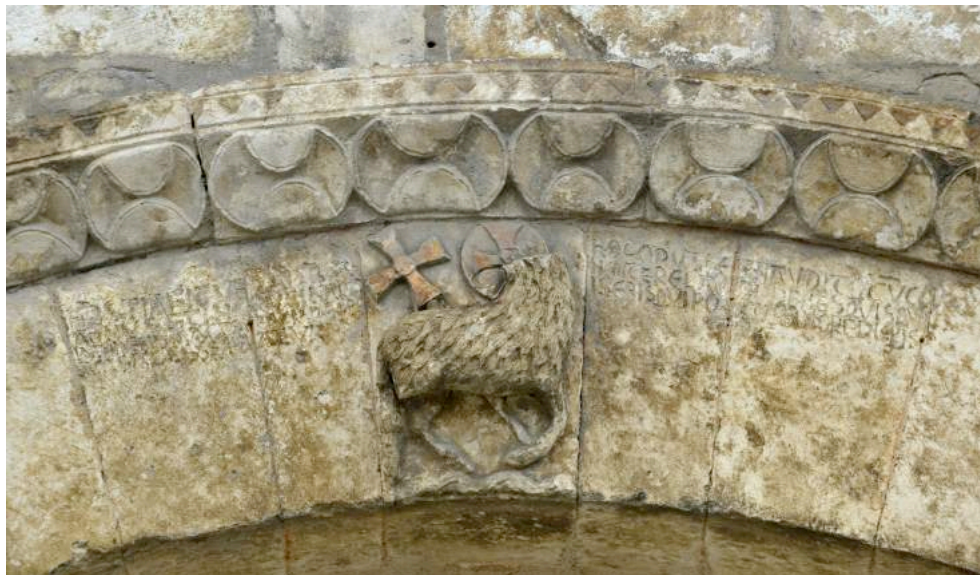
Fig. 6. Inscription avec la signature d'Hernaodus et Agnus Dei , milieu du XII e siècle, Ardentes (Indre), Saint-Martin, portail nord, clef d'arcade © Photo: Emilie Mineo.

La qualité formelle d'une réalisation épigraphique n'est pas la condition nécessaire ou suffisante pour apprécier la capacité à écrire de l'artiste. Vers le milieu du XII e siècle, un certain Hernaodus a laissé son nom dans une inscription au texte assez développé et en vers sur le portail nord de l'église Saint-Martin à Ardentes (DEBIAIS et al. , 2014, 25, Indre, n°1, p. 17-18) (fig. 6). L'ambition littéraire du choix de la forme métrique contraste avec la qualité esthétique de l'exécution graphique: la mise en page y est assez sommaire et l'écriture irrégulière. Si le scripteur avait eu un modèle à reproduire, la forme des lettres aurait probablement été plus constante. À mon sens, l'inscription a été réalisée par une personne qui savait écrire (même si à un niveau assez élémentaire) mais qui n'avait pas l'habitude de le faire avec cette technique. 9 Un rapport occasionnel à l'écrit épigraphique expliquerait le caractère approximatif de l'écriture.