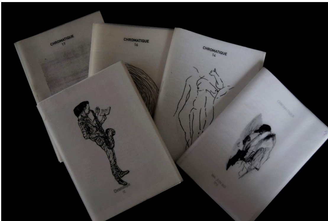
Troisième génération de la revue Chromatique

Lors de chaque publication, les membres assurent eux-mêmes la distribution du numéro, adressant certains exemplaires à leurs amis et à ceux qui ont manifesté leur intérêt à l'égard du projet, en déposant d'autres dans des lieux stratégiques (bibliothèques facultaires, cafés