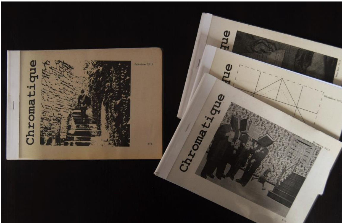
Premiers numéros de Chromatique

reprises de dimensions, passant d'une maquette A5 à l'italienne et plastifiée à un format à la française plus proche du fanzine (n° 8), avant de se muer en un délicat A6 garni de papier calque (n° 11).