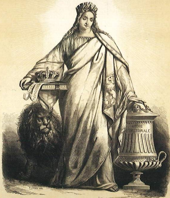
ARTICLE 25 DE LA CONSTITUTION. TOUS LES POUVOIRS ÉMANENT DE LA NATION.