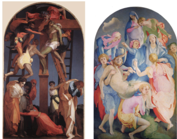
Fig. 6 et 7

La Ricotta justement, se laisse voir comme un tissage formel et sémantique complexe, à la faveur d'un réseau intertextuel très dense. Sur fond de reconstitution cinématographique de deux tableaux maniéristes figurant la Passion du Christ 40 , le film raconte l'histoire de Stracci (« haillons » en français), un figurant crève la faim qui remuera ciel et terre pour trouver à manger et finira par mourir d'une indigestion, attaché à une croix, alors que venait enfin son heure de figurer l'un des deux larrons entourant le Christ. Les deux imposantes toiles, reconstituées en tableaux vivants, se voient largement démystifiées par l'incapacité du réalisateur à aboutir et « donnant une représentation très clinquante du spectacle de la Passion que le manque de sérieux des figurants achève de rendre vulgaire. » 41 Pasolini s'en prend à l'exubérance formelle caractéristique d'un courant pictural faisant la part belle aux apparences, comme il s'attaque conjointement à cette bourgeoisie italienne bigote et vieillissante, croyante par convention et manifestement inapte à ouvrir les yeux sur la véritable Passion de son temps: la misère des classes prolétaires qu'incarne Stracci.