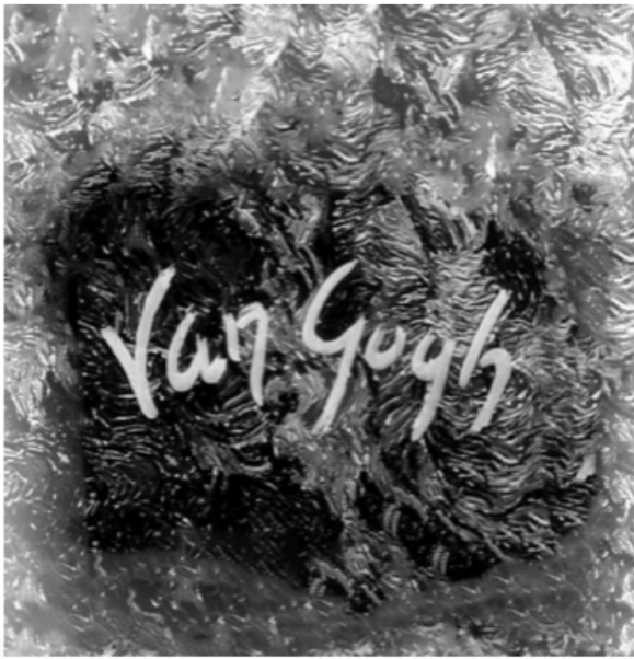
Fig. 5 C'est là tout l'enjeu du Van Gogh d'Alain Resnais. Davantage que donner vie aux tableaux eux-mêmes – l'usage du noir et blanc, en premier lieu, ne le permet pas, et telle n'est pas son entreprise 27 – Resnais semble faire renaître le peintre en tant que regard, conscience créatrice. « Il me semble toujours être un voyageur qui va quelque part et à une destination » 28 cite le film en ouverture, annonçant d'emblée qu'il entend donner la parole à l'auteur des peintures et en conter le voyage, le parcours, le processus. C'est autour

du regard de Van Gogh que Resnais compose son film et décompose les tableaux, faisant fi des conventions: il se réapproprie les œuvres, décroïssonne les genres et les formes, procède par assemblages hétérogènes de toiles, mouvements, lettres lues, etc. Opérant une véritable rencontre entre peinture et cinéma, il questionne la prétendue hétérogénéité des médiums.