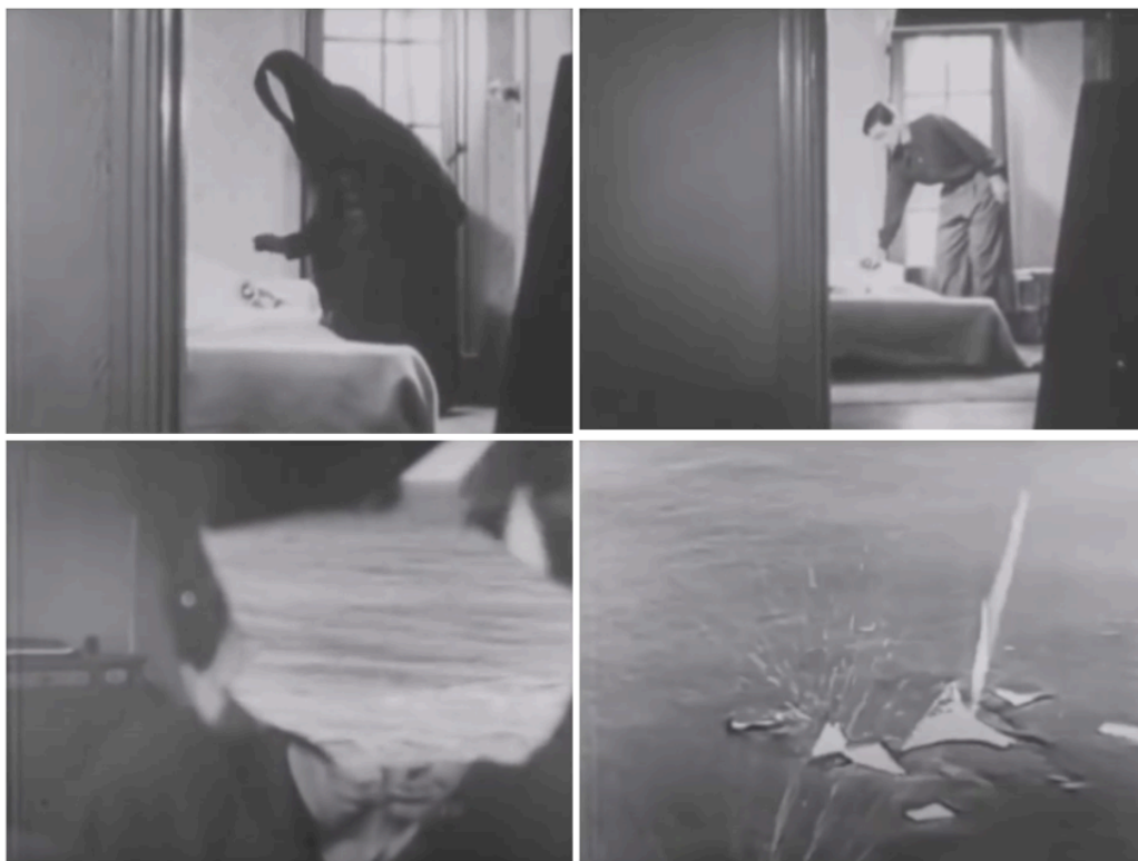
Fig. 20, 21, 22 et 23

Deren. C'est un vide qui se situe là où devrait se trouver l'image même du sujet, une surface vide d'un néant énigmatique qui a substitué le visage, lieu de l'identité visuelle. 92