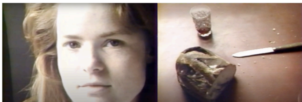
Fig. 1 et 2

fragments d'intimité récipiendaires d'une certaine charge expressive, symbolique ou métaphorique. Et cette voix, guidant la caméra comme un fil de pensée, dite à mesure que l'image s'enregistre, et qui par la suite deviendra incontournable dans le cinéma de Cavalier.