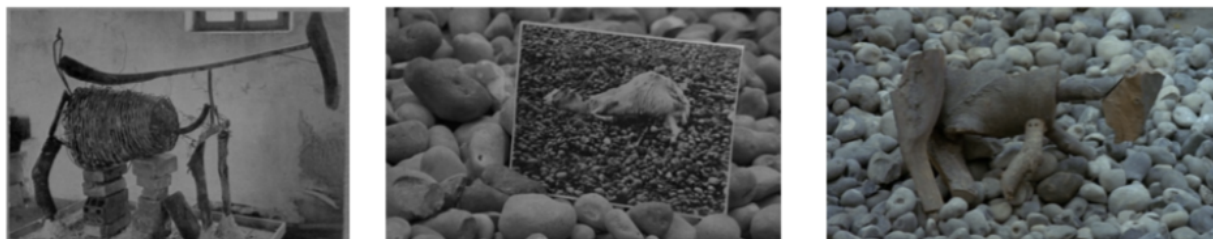
Fig. 13, 14 et 15

déchets, de bric et de broc, devenue célèbre et bronzée, aussi célèbre que la chèvre Amalthée pour avoir nourri Zeus. Ni celle de Monsieur Seguin, tenant tête au loup. Ni celle, autre épave, de Couturier. Mais une chèvre, une chèvre, n'importe quelle chèvre. 74