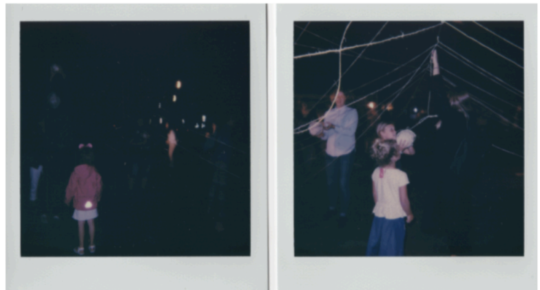
Fig. 10 et 11

L'expérience que propose cette installation, comme mise en mouvement du corps collectif, est lourde de charge symbolique: des chemins se croisent, aléatoires mais mus par des forces directionnelles. Des trajectoires humaines, des comportements, des empreintes culturelles, idéologiques, divers habitus 47 , sont soumis à l'instabilité d'un milieu changeant et modelé par les variations du son et de la lumière. C'est en somme un ensemble de facteurs hétérogènes qui font du corps collectif un tout en métamorphose.