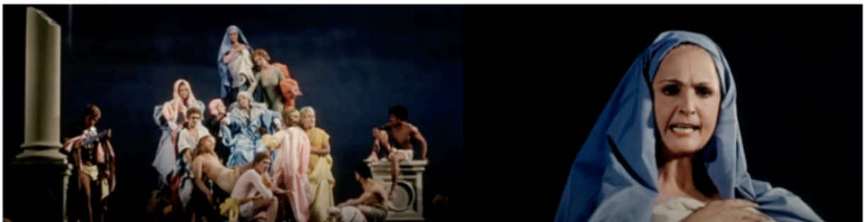
Fig. 8 et 9

Mon goût cinématographique n'est pas d'origine cinématographique, mais pictural. [...] Je n'arrive pas à concevoir des images, des paysages, des compositions de figures, en dehors de ma passion fondamentale pour cette peinture du Trecento, qui place l'homme au centre de toute perspective. Quand mes images donc, sont en mouvement, elles sont en mouvement un peu comme si l'objectif se déplaçait devant un tableau: je conçois toujours le fond comme le fond d'un tableau, comme un décor, c'est pour cela que je l'attaque toujours de front. Et les figures se déplacent sur cette toile de fond de façon toujours symétrique, à chaque fois que c'est possible : gros plan contre gros plan, panoramique-aller contre panoramique-retour, rythmes réguliers (ternaires, si possible) des plans, etc. Il n'y a presque jamais de montages gros plans / plans généraux.[...] 42