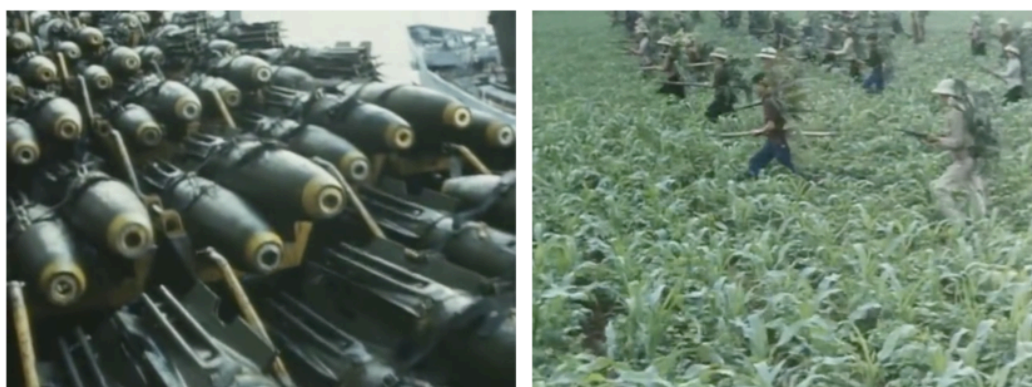
Fig. 24 et 25

Si l' écart – à commencer par celui de la distance – fait ici fonction de paradigme, c'est que s'y dessine le point de convergence entre un propos et une approche formelle résolument singulière. Comment témoigner d'une situation qu'on ne vit qu'à l'écart, à côté, loin? Que peut-on en dire sans la vivre? Et surtout quelle force, au milieu des bombes, peut bien avoir le cinéma? Loin du Vietnam , c'est un conflit d'images et d'imaginaires, un conflit d'idéaux; une distance géographique comme une distance symbolique: celle qui sépare les hommes qui luttent, physiquement, de ceux qui prennent part au conflit par le travail des images. Le grand mouvement du film sera alors d'y inscrire ces écarts, ces vides impossibles à combler comme l'est la collision, d'entrée de jeu, entre les images d'une « guerre de riches » et celles d'une « guerre de pauvres ».