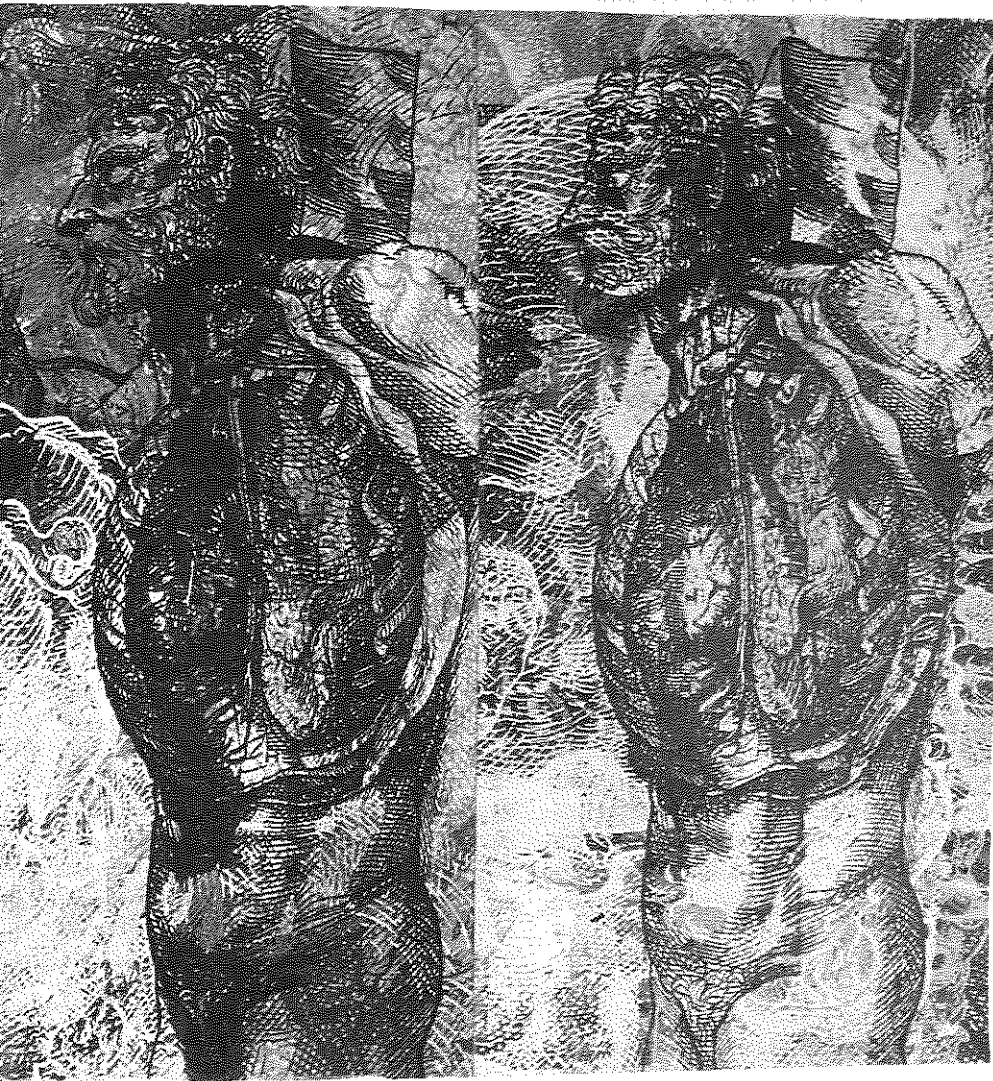
De humani corporis fabrica, Alain Paul, sérigraphie, 15" x 32".

Les critères permettant de déterminer quel est le meilleur intérêt du malade restent néanmoins difficiles à établir. Ils devraient permettre d'évaluer en quoi consiste la qualité de la vie pour la personne qui ne peut s'exprimer. Il est sans doute plus facile et moins dangereux de dire ce qu'ils ne doivent pas être plutôt que d'établir une liste positive de ce qu'ils devraient être. L'évaluation de la qualité de la vie se fait avant tout au nom de la personne concernée et donc au cas par cas. En ce sens, elle semble au moins devoir tenir compte et de la valeur intrinsèque de la vie humaine et de la qualité proprement dite de cette vie 9 . La valeur intrinsèque fait fi de toute relativité de la valeur humaine d'une vie individuelle par rapport à une autre. La comparaison entre les vies semble ici d'une aide médiocre car la référence à l'utilité ou à l'importance sociale n'est nullement requise.