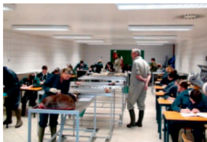
Un examen en steep le chase