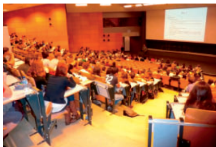
Réunion des 450 étudiants vétérinaires (bac 1 à 3) au Pedro Aruppe en septembre 2012 pour un tutorat vertical