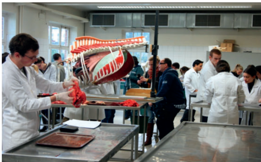
Travaux dirigés intégrés sur la fonction cardio-respiratoire

La première réside dans le développement d'un apprentissage collaboratif de l'anatomie animale par groupes inter-années (bac 2 et 3) sur le mode du TBL (Team Based Learning) au départ de situations cliniques (cf. Michaelsen & Sweet, 2008 pour plus de détails sur cette méthode). Ces situations seront définies en croisant les familles de situations professionnelles que nous venons d'établir pour les vétérinaires de la communauté française de Belgique (Vandeweerd et al., 2013), et les six régions anatomiques étudiées (tête, membre thoracique, thorax, abdomen, membre pelvien, bassin et rachis). L'approche par problème placera immédiatement l'étudiant dans un contexte de pratique professionnelle, ce