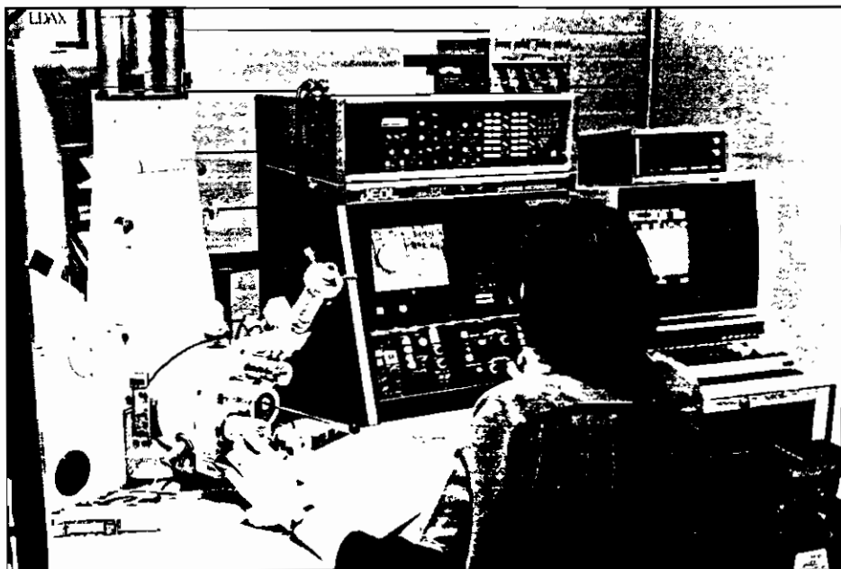
Le processus d'évaluation technologique vise à répondre par exemple à cette question : quels sont les groupes sociaux qui risquent d'être affectés par les effets consécutifs à l'application de cette technologie?

A de telles méthodes, on en préférera d'autres, refusant de voir dans le poids du passé l'élément déterminant du futur, exprimant a priori une volonté de changement. On songe à l'analyse de systèmes, à la méthode des arbres de perti-