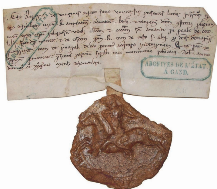
FIG. 1. — Acte de cautionnement de Roger de Wingene, novembre 1231. Original sur parchemin, 130/135 × 45 mm (repli fermé)

devenue aujourd'hui rarissime dans les archives 27 , en raison certainement de leur caractère éphémère, ces documents jettent une lumière exceptionnelle sur la situation économique de l'aristocratie dans la première moitié du XIII e siècle et sur les opérations de prêt auxquelles s'adonnaient alors les couches aisées de la bourgeoisie urbaine — en particulier à Arras, qui fut durant tout le siècle une place bancaire majeure dans le nord de l'Europe 28 . Ils mériteraient à cet égard une étude spécifique. Du point de vue qui nous occupe ici, la principale question qui se pose est précisément de savoir pourquoi les sires de Béthune ont laissé ces parchemins périmés (remontant pour certains aux années 1200 29 !) s'accumuler par dizaines dans leurs archives, plutôt que de les éliminer sitôt la transaction soldée. Peut-être ces actes, tous scellés par leur auteur, constituaient-ils une illustration plaisante de la surface sociale des sires, une galerie de cire célébrant leurs bonnes relations avec les princes, les barons et les vassaux plus modestes qui sollicitaient leur appui pour convaincre les banquiers d'ouvrir leurs coffres. Mais cette lecture symbolique reste une hypothèse à ce stade de l'enquête.