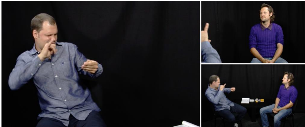
Figure 2. Illustration des données filmées

L'échantillon de données sélectionné pour l'étude se base sur les échanges de deux dyades de participants sourds natifs de la LSFB âgés entre 22 et 33 ans. La Figure 2. illustre le type de données étudiées : les signeurs participent par deux et sont assis l'un face à l'autre. Trois caméras filment les échanges qui ont lieu : deux d'entre elles se concentrent sur chaque participant et une troisième reprend la dyade de profil.