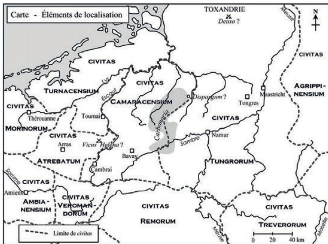
Fig. 1. Carte explicative.

Dans une étude magistrale parue en 2001, Phillip Wynn a souligné combien la géographie de Grégoire esquissée ici était autant, sinon davantage, symbolique qu'historique. Sa vision de la Gaule comme une Terre Sainte, et de la Loire comme un nouveau Jourdain, les réminiscences de la Vulgate qui émaillent son texte