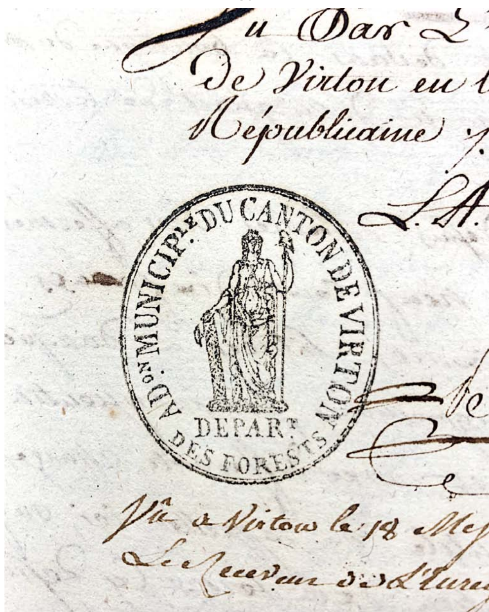
AÉ Arlon, Département des Forêts, 425/19 : Vente des biens nationaux à Dampicourt