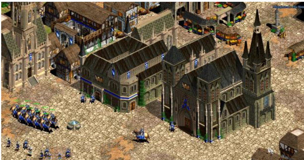
La cité de Liège

Plus récemment (mai 2013), cette production amateur a bénéficié d'une mise à jour ajoutant la possibilité d'incarner la civilisation liégeoise. Celle-ci dispose d'unités, de héros (Jean de Bavière), de constructions (la Cathédrale Saint-Lambert, le Palais des Princes-Évêques) et de campagnes militaires qui lui sont propres (voir illustrations ci-dessous).