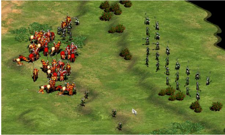
L'infanterie de Liège en pleine bataille

Ce détournement du jeu Age of Empires II a été réalisé par des joueurs passionnés d'Histoire 4 qui, insatisfaits du contenu de l'œuvre originale, souhaitent nourrir et préciser ce dernier. Néanmoins, le succès que le mod (diffusé librement sur Internet) a rencontré auprès des joueurs ne semble pas s'expliquer uniquement par cette ambition de rigueur intellectuelle. Une autre cause en est, plus simplement, le plaisir qu'ont pris les utilisateurs à jouer leur propre civilisation et revivre leur Histoire. En ce sens, cet exemple précis de réappropriation témoigne du profond intérêt que représente le modding pour l'industrie du jeu vidéo et éclaire l'importance croissante qui lui est accordée. En effet, la possibilité de réappropriation que le médium vidéoludique offre à ses utilisateurs peut avoir des conséquences très favorables sur les œuvres détournées et ce, à plusieurs niveaux.