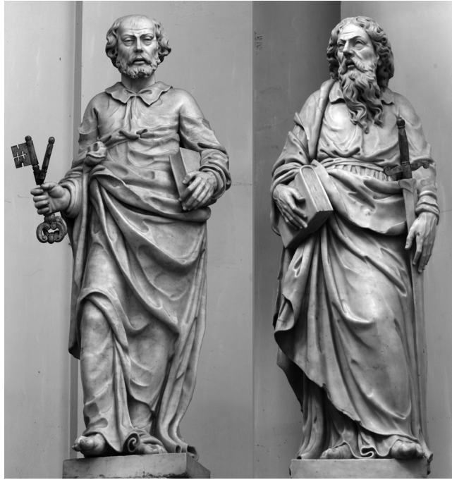
Fig. 1 : PIERRE ENDERLIN (ca. 1603-ca. 1664), Saint Pierre et saint Paul , ca. 1648 Marbre, h. 190 cm. Namur, cathédrale.