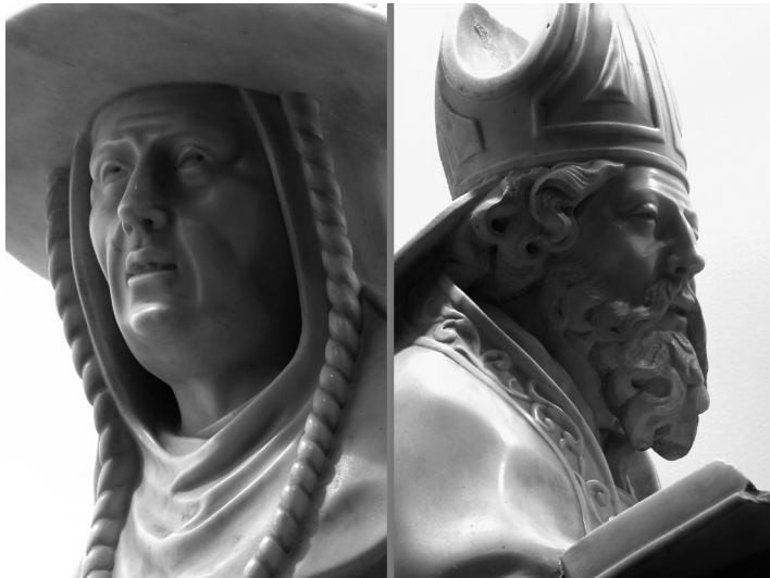
Fig. 5 : PIERRE ENDERLIN (ca. 1603-ca. 1664), Saint Jérôme et saint Ambroise (détails), ca. 1648 Marbre, h. 120 cm. Floreffé, ancienne église abbatiale.