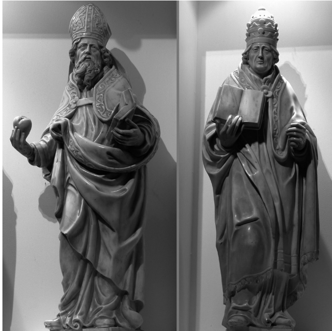
Fig. 4 : PIERRE ENDERLIN (ca. 1603-ca. 1664), Saint Augustin et saint Grégoire , ca. 1648 Marbre, h. 120 cm. Floreffé, ancienne église abbatiale.