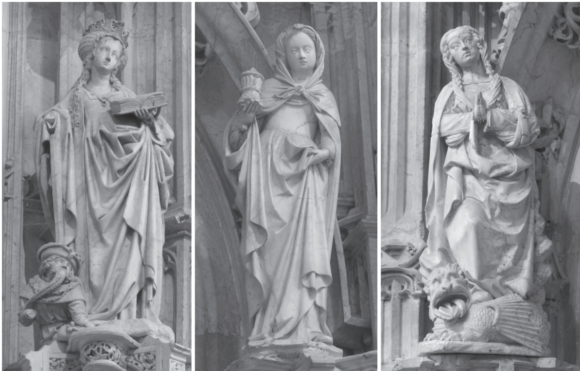
Fig. 3. Sainte Catherine, sainte Marie-Madeleine et sainte Marguerite , albâtre, Bourg-en-Bresse, église du monastère de Brou.

et des compositions du drapé peuvent aisément être mis en relation avec la grande école bruxelloise de sculpture, et plus spécifiquement avec le groupe Borman. Certaines figures, par leur type et leur expression renvoient même explicitement à des modèles bormanesques (e. a. figure de Maximien foulée aux pieds par sainte Catherine) (fig. 3). On observera un certain assouplissement dans le traitement de l'étoffe des figures de sainte Marie-Madeleine et de sainte Marguerite (fig. 3). Enfin, divers accessoires et ornements des figures de cet ensemble attestent de l'introduction du nouveau goût pour la Renaissance.