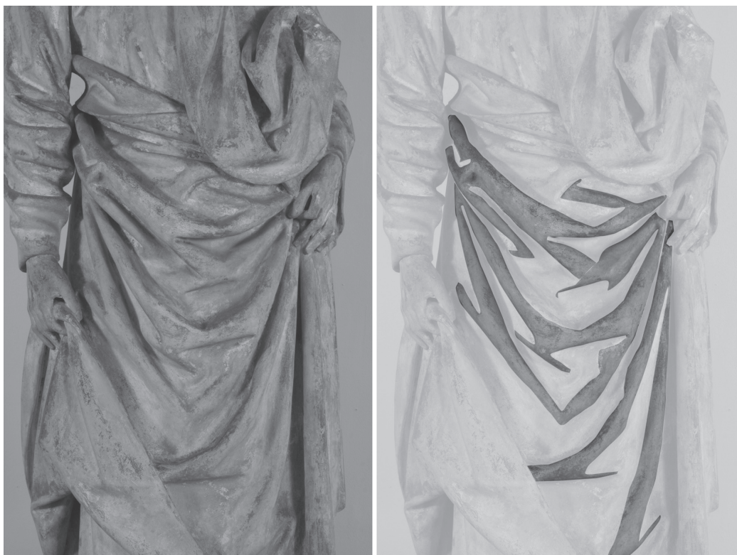
Fig. 7. Saint André (détails), pierre calcaire, Nivelles, musée archéologique.