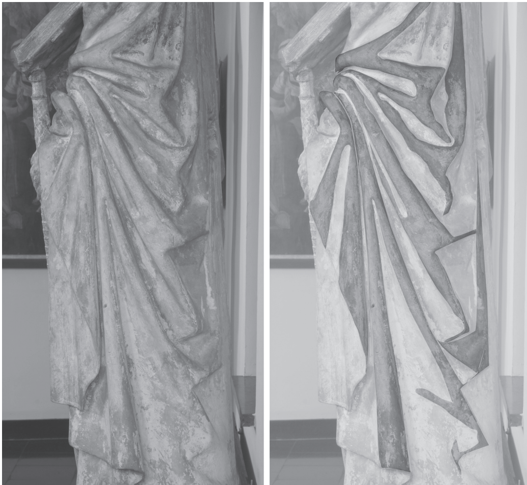
Fig. 6. Saint Paul (détails), pierre calcaire, Nivelles, musée archéologique.