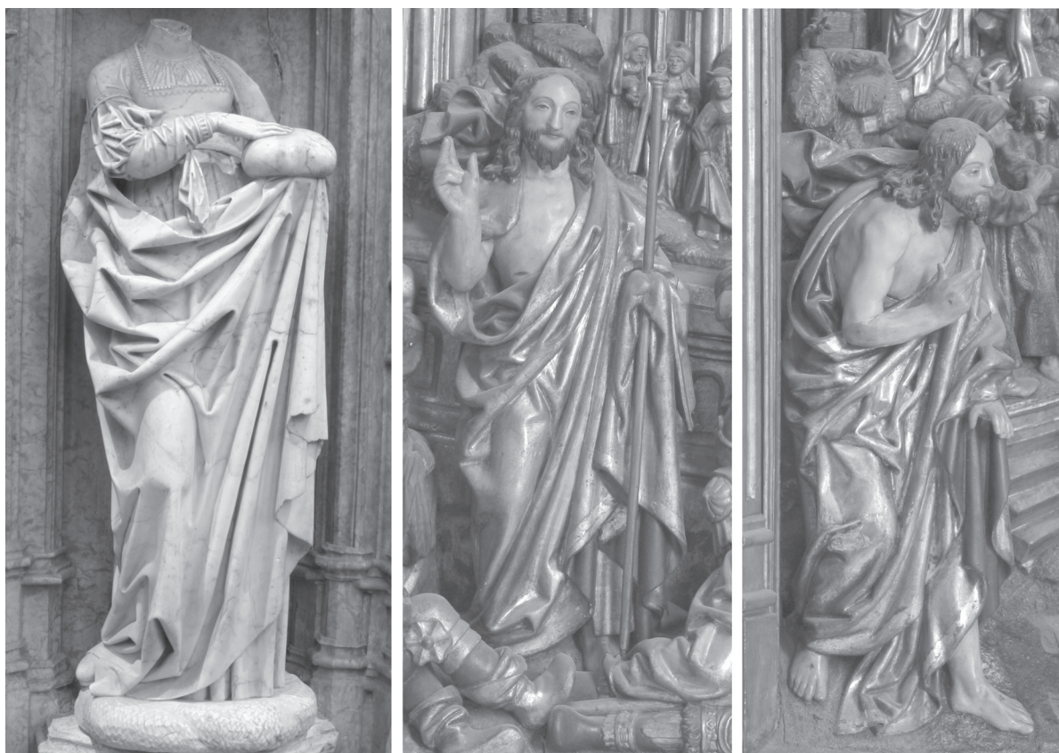
Fig. 8. Sibylle (?) , albâtre, Bourg-en-Bresse, église du monastère de Brou; Christ de la Résurrection , bois polychromé, retable de la Passion de la Marienkirche à Güstrow; Christ de l'Apparition à Marie-Madeleine , bois polychromé, retable de la Passion de la Marienkirche à Güstrow.

triques, suite à l'amenuisement de l'une des branches du pli, puis à sa disparition. Ce type de pli particulier, en pince à bec à une branche, se retrouve précisément dans la coule de saint Nicolas de Tolentin à Brou (fig. 4). D'autres aspects lient encore la Vierge de Nivelles et le Christ de Douleur de Brou, notamment la géométrisation extrême des plis tuyautés qui se brisent à la hauteur du poignet (fig. 5). Quant à la formule des plis en pince à bec à une branche, elle se retrouve, traitée un peu différemment, dans la statue d'apôtre non identifié de Nivelles. Le rythme est cette fois plus rapide, car la composition est plus serrée et que de grands plis en pince à bec – à une ou deux branches – s'immiscent dans le réseau des polygones. Cette conception différente du drapé atténue donc la lisibilité de l'organisation de la séquence. Tel n'est pas le cas dans la plus célèbre des statuette de sibylle (?) de Brou, dite d'Agrippa, ou encore dans la statue de saint Nicolas Tolentin (face) où la formulation