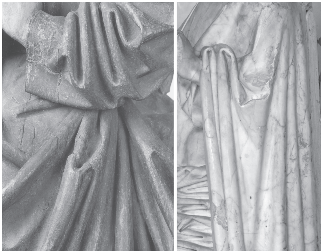
Fig. 5. Vierge dite de l'Immaculée Conception (détail), chêne polychromé, Nivelles, collégiale Sainte-Gertrude; Christ de douleur (détail), albâtre, Bourg-en-Bresse, musée du monastère de Brou.