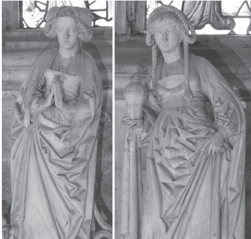
Fig. 10. Sainte Marguerite , albâtre, Bourg-en-Bresse, église du Monastère de Brou; Sainte Madeleine , albâtre, Bourg-en-Bresse, église du Monastère de Brou.