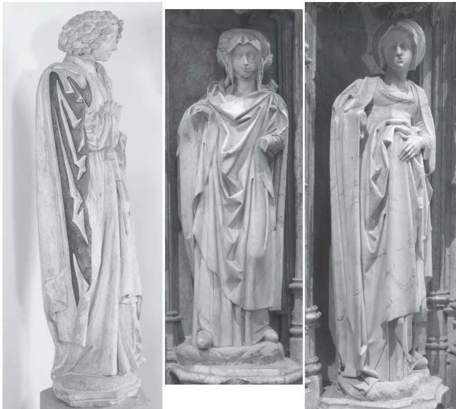
Fig. 9. Saint Jean , pierre calcaire, Nivelles, musée archéologique; Sibylle (?) , albâtre, Bourg-en-Bresse, église du Monastère de Brou; Sibylle (?) , albâtre, Bourg-en-Bresse, église du Monastère de Brou.