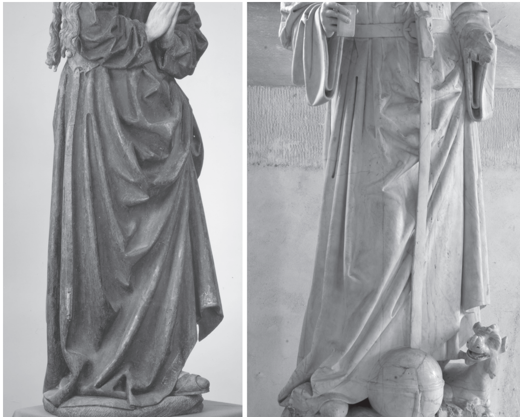
Fig. 4. Vierge dite de l'Immaculée Conception (détail), chêne polychromé, Nivelles, collégiale Sainte-Gertrude; Saint Nicolas de Tolentino (détail), albâtre, Bourg-en-Bresse, musée du monastère de Brou.