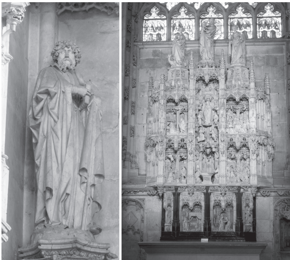
Fig. 1. Saint Philippe , albâtre; Retable des Sept Joies de la Vierge , albâtre et marbre, Bourg-en-Bresse, église du monastère de Brou.

saints debout et des évangélistes assis sous les dais du cadre architectural, ainsi que des anges volants au-dessus des scènes, complètent cette série de figurines renaissance.