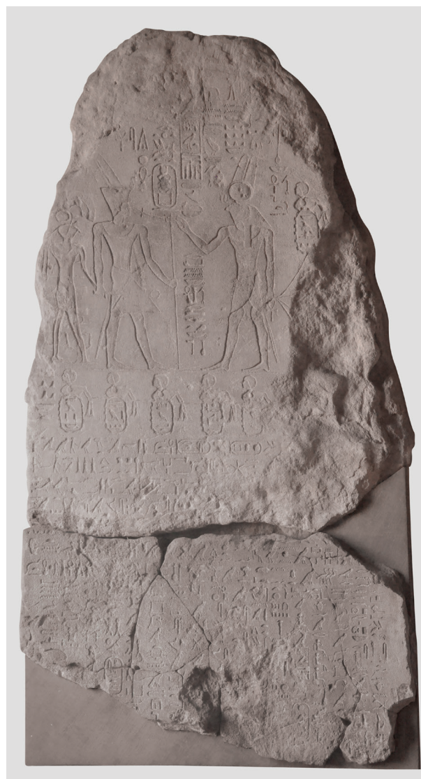
Fig. 1. Stèle de l'an 18 de Sésostris I er à Bouhen. Florence, Museo Archeologico, inv. 2540

Sinouhé et sans doute l'Enseignement loyaliste . Il organise la colonisation de la Basse Nubie, construisant en aval de la deuxième cataracte la forteresse de Bouhen, où il établit la frontière sud de l'Égypte. Une stèle découverte sur place rapporte qu'en l'an 18 de son règne une vaste expédition militaire atteint Kouch, royaume nubien centré sur Kerma au sud de la troisième cataracte, à qui sera imposé le versement d'un tribut (fig.1). Une expédition au pays de Pount, au départ de Mersa Gaouasis sur la mer Rouge, rencontre le succès et encourage ses successeurs à réitérer l'exploit. Il multiplie les expéditions aux carrières du désert oriental et mène une politique de constructions dans