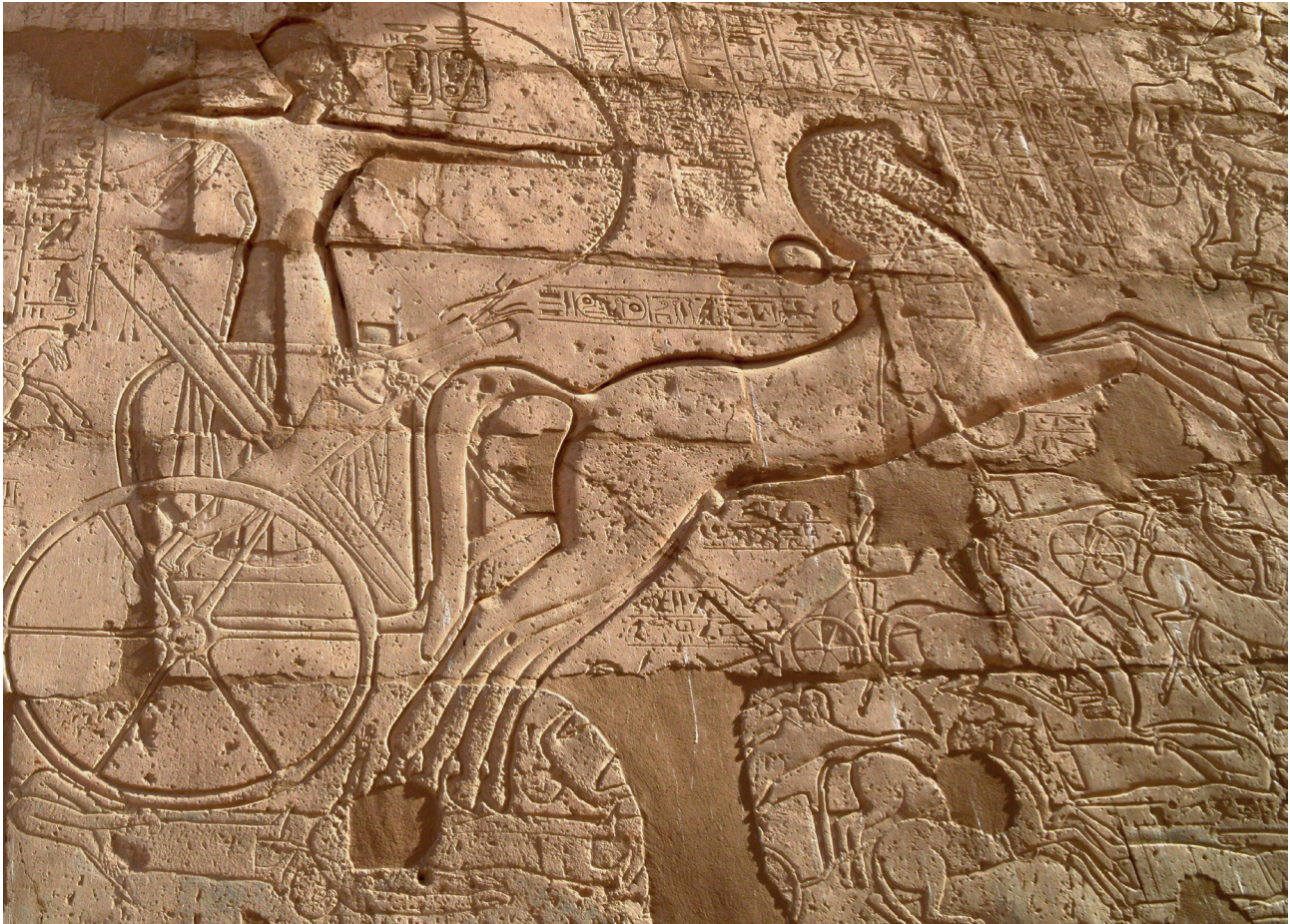
Fig. 5. Ramsès II à Qadech, Ramesseum