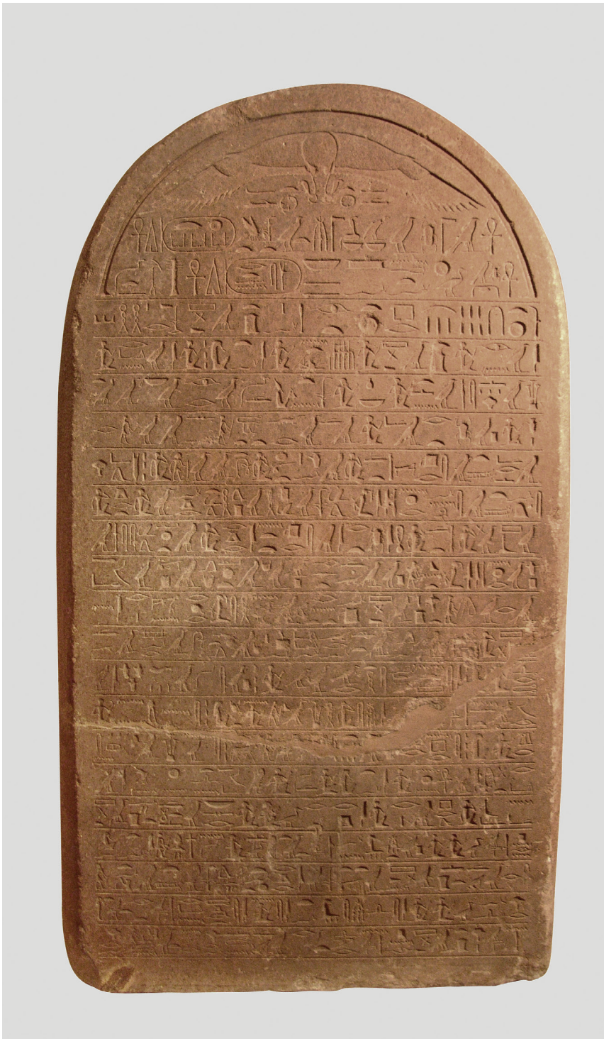
Fig. 2. Stèle de l'an 16 de Sésostri III à Semna. Berlin, Ägyptisches Museum und Papyrussammlung, inv. 1157