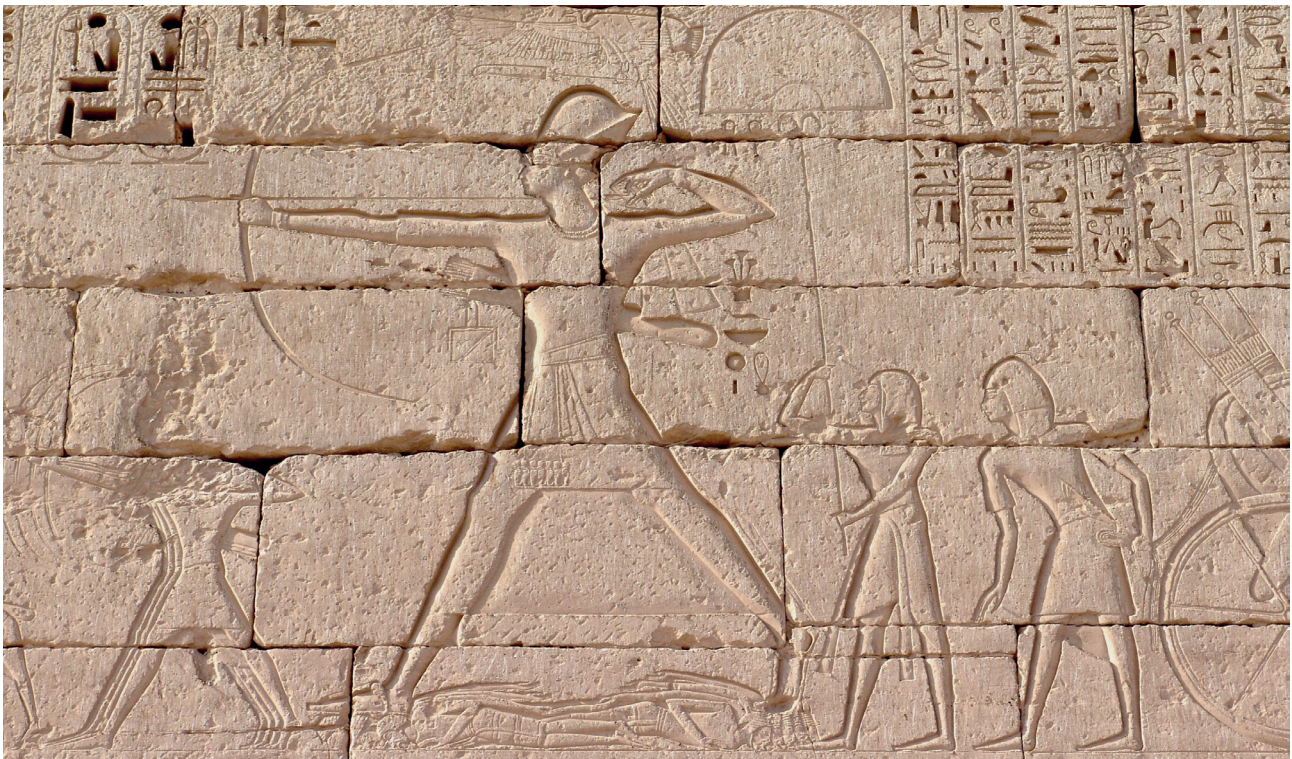
Fig. 6. Ramsès III contre les peuples «de la mer», Médinet Habou