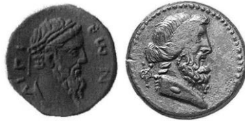
Figure 3. Comparaison des droits d'une monnaie d'Aigion et d'une monnaie au nom de Procléius

La datation avancée par ce dernier reposait en effet sur la ressemblance du droit de ces exemplaires avec ceux des monnaies d'Antonin le Pieux ; pourtant le rapprochement que l'on peut effectuer avec certains droits de l'émission de Procléius à Céphallénie nous paraît tout aussi pertinent 62 , comme l'illustre la figure 3 :