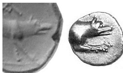
Figure 1. Comparaison entre une monnaie de bronze argienne de la catégorie 2 et une drachme

Or, on observe au sein des monnaies de la catégorie 4 une évolution du système de marquage analogue à celle des monnaies d'argent, où un nom en toutes lettres succède à deux lettres ; le « ΠΑ » des monnaies de la catégorie 4b (pl. I, n° 7) pourrait bien annoncer ainsi le nom de ΠΑΜΦΑΗΣ figurant sur les exemplaires de la catégorie 4c (pl. I, n° 8). Il est également légitime de penser que ce changement est contemporain de celui survenu sur les monnaies d'argent. D'ailleurs, la comparaison stylistique de la figure 1 révèle que le graveur « I » a participé, d'une part, à la réalisation des monnaies en bronze de la catégorie 2 — qui, rappelons-le, présente des liens avec les catégories 1 et 4 — et, d'autre part, aux émissions de drachmes marquées ΦΑ qui, elles, ont directement précédé les émissions au nom de ΦΑΗΝΟΣ :