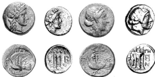
Figure 2. Comparaisons entre les droits de monnaies de bronze sicyoniennes et argiennes

On voit donc bien ici à quelles difficultés mène l'adoption de chronologie basse : peut-on admettre, en effet, que le changement de système de marquage ne fut pas concomitant pour les émissions d'argent et de bronze à Messène, de même que ce changement ne fut pas coordonné à l'ensemble du Péloponnèse ? Un rapide coup d'œil sur les monnayages concernés suffit à nous convaincre qu'ils sont tous, d'une manière ou d'une autre, apparentés. Les exemplaires sicyoniens du groupe 12 reprennent le même type de droit — Apollon — que celui de notre catégorie 3 à Argos ; certains coins sont d'ailleurs très proches stylistiquement, au point qu'il paraît évident que les deux cités avaient fait appel aux mêmes artisans pour réaliser leurs émissions (cf. figure 2 ), comme elles le faisaient déjà au IV e s. 40 et le feront encore à l'époque romaine 41 .