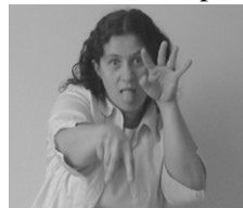
[6] REGARDER (3 e personne)