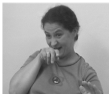
[7] AVANCER (transfert)