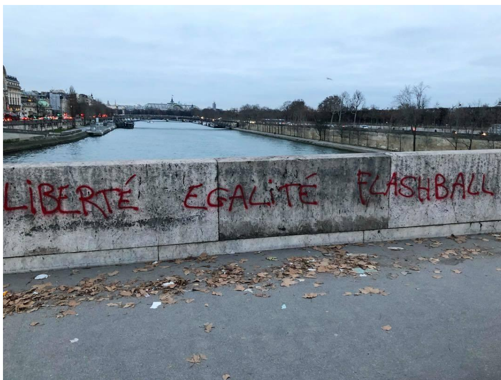
« Liberté, égalité, flashball »

proposition de « Grand débat national » 54 est ainsi tenue pour une manœuvre dilatoire et se voit largement fustigée (« Le grand débat, c'est dans le rue », « On débattrà quand on vous aura tous virés », « Ce n'est qu'un débat, le combat continue », « La grande débâcle », « Vivement le grand dégât national ! », « On préfère les grands ébats au grand débat » et « On veut pas votre débat, on veut votre départ. Tu saisis la nuance, connard ? »), tandis que la lecture de la « Lettre aux Français » par le Président en fonction, le 13 janvier 2019 55 , favorise l'apparition du tag « La seule lettre qu'on veut recevoir : celle de ta démission ».