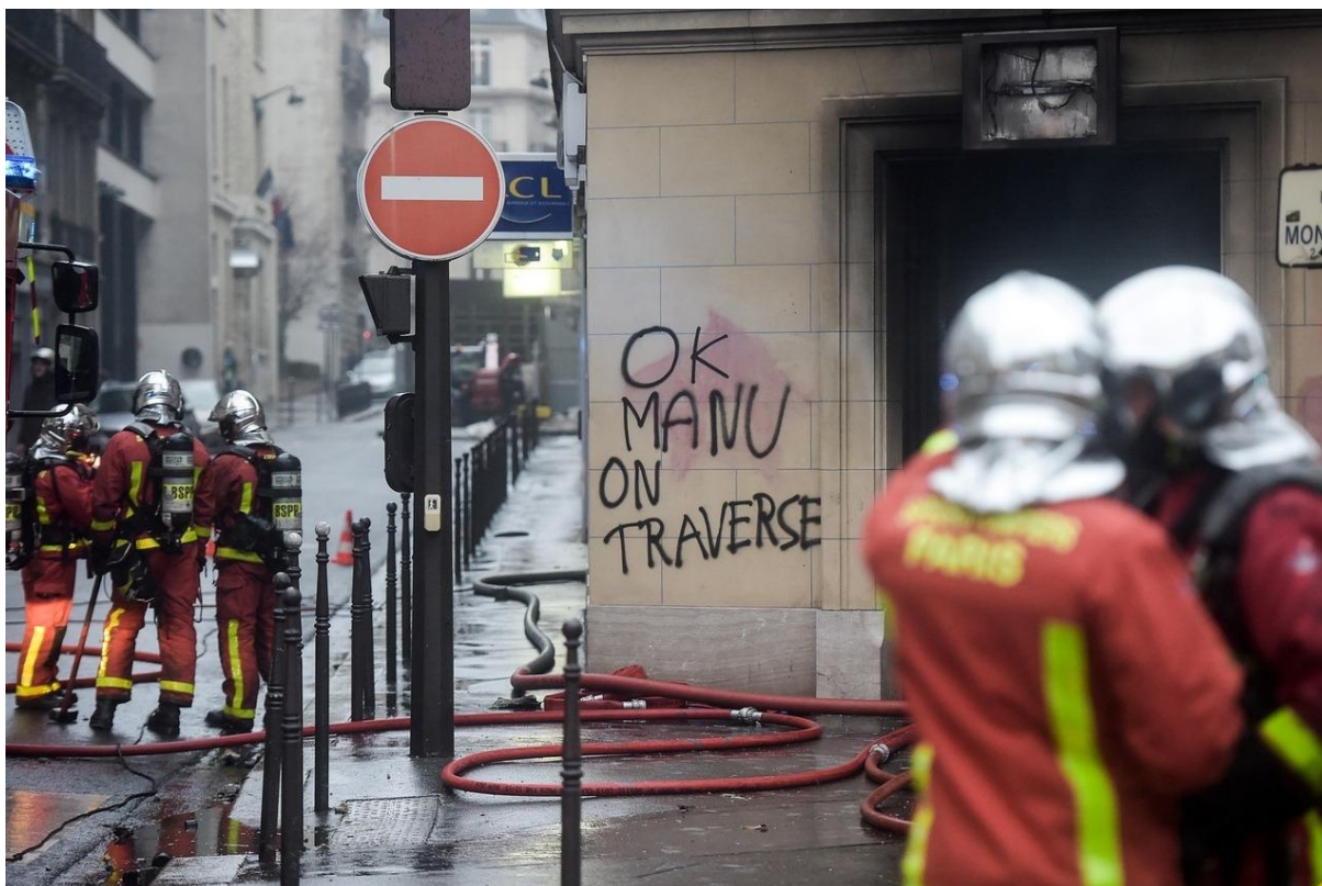
« Ok Manu on traverse »

Le rire, du reste, est loin d'empêcher la lucidité. En plus de s'attaquer aux slogans publicitaires et aux grandes enseignes dans le but de les retourner contre eux-mêmes (sur les façades du groupe Cartier, spécialisé dans la joaillerie et les produits de luxe, on peut lire « Pas de Cartier pour les riches » ; celles de la maroquinerie Lancel offrent l'occasion d'un « LancelE PAVÉ »), les Gilets jaunes s'en prennent volontiers aux formules toutes faites employées par le Président Macron et qui ont souvent suscité la polémique 44 . On trouve de cette manière des slogans comme : « Ceux qui ne sont rien sont partout » 45 ; « La meilleure façon de se payer un costard, c'est de piller chez Zadig et Voltaire » 46 ; « Le revenu des fainéants, c'est le dividende » 47 ; « Soyons l'étincelle qui met le feu à la poudre