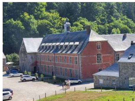
Le site actuel de l'ancienne abbaye du Vivier, destiné à devenir un lieu de restauration et de loisir ainsi qu'un espace de coworking

Le projet implique également la valorisation des fonds d'archives auprès du grand-public, des étudiant·es et des chercheur·ses. Ceci suppose, bien sûr, la publication de travaux et d'inventaires, la participation à des colloques, mais aussi l'encadrement d'unités d'enseignement dont le but est d'initier à la recherche ou aux sciences auxiliaires de l'histoire. Lors de l'année académique 2022-2023, des séances de travaux ont ainsi été organisés in situ , aux Archives de l'État à Namur, dans le cadre des