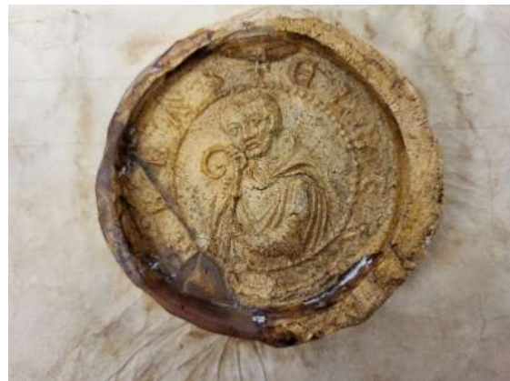
Sceau d'Eilbert, abbé, apposé sur un acte daté de 1140.