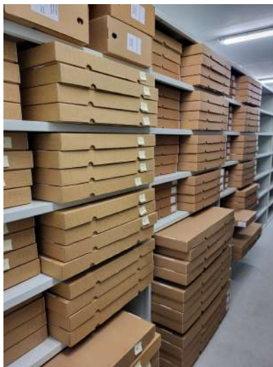
Fonds de l'abbaye Saint-Jacques de Liège : première moitié du fonds ayant d'ores et déjà fait l'objet d'un inventaire

Il n'est guère possible, pour l'instant, de fournir une liste exhaustive des fonds en attente d'inventoriage – un « cadastre » de ceux-ci aurait d'ailleurs toute son utilité... Une série d'exemples glanés au hasard des dépôts suffit à prouver que le besoin de tels travaux est réel. De très riches fonds restent encore mal connus. Tel est le cas du chartrier de l'abbaye Saint-Jacques de Liège (un peu moins de 2000 actes, du XI e au XVIII e siècle), de celui de Notre-Dame du Vivier à Marche-les-Dames (approximativement 1000 chartes, majoritairement pour les XV e -XVI e siècles), de Saint-Bernard-sur-l'Escaut à Hemiksem (environ 1300 chartes, du XII e au XVIII e siècle), du Val-des-Vierges à Audenarde (nombre d'actes inconnu, du XIII e au XVIII e siècle), ou encore de l'hôpital de Rebecq-Rognon (nombre d'actes inconnu, du XIII e au XVIII e siècle). Si les archives ecclésiastiques sont, bien évidemment, concernées au premier chef par ce besoin d'inventaire, de tels manques se repèrent également au niveau des fonds issus d'institutions laïques ou de familles aristocratiques. On songe, par exemple, aux archives de la ville de Huy ou à celles relatives à la seigneurie de Lexhy. Dès février 2022, un travail d'inventoriage a été entrepris pour le fonds de l'abbaye bénédictine Saint-Jacques de Liège, dont les archives ont, en outre, fait l'objet d'une restauration. À l'heure où nous écrivons ces lignes, une première moitié du fonds a d'ores et déjà été inventoriée.